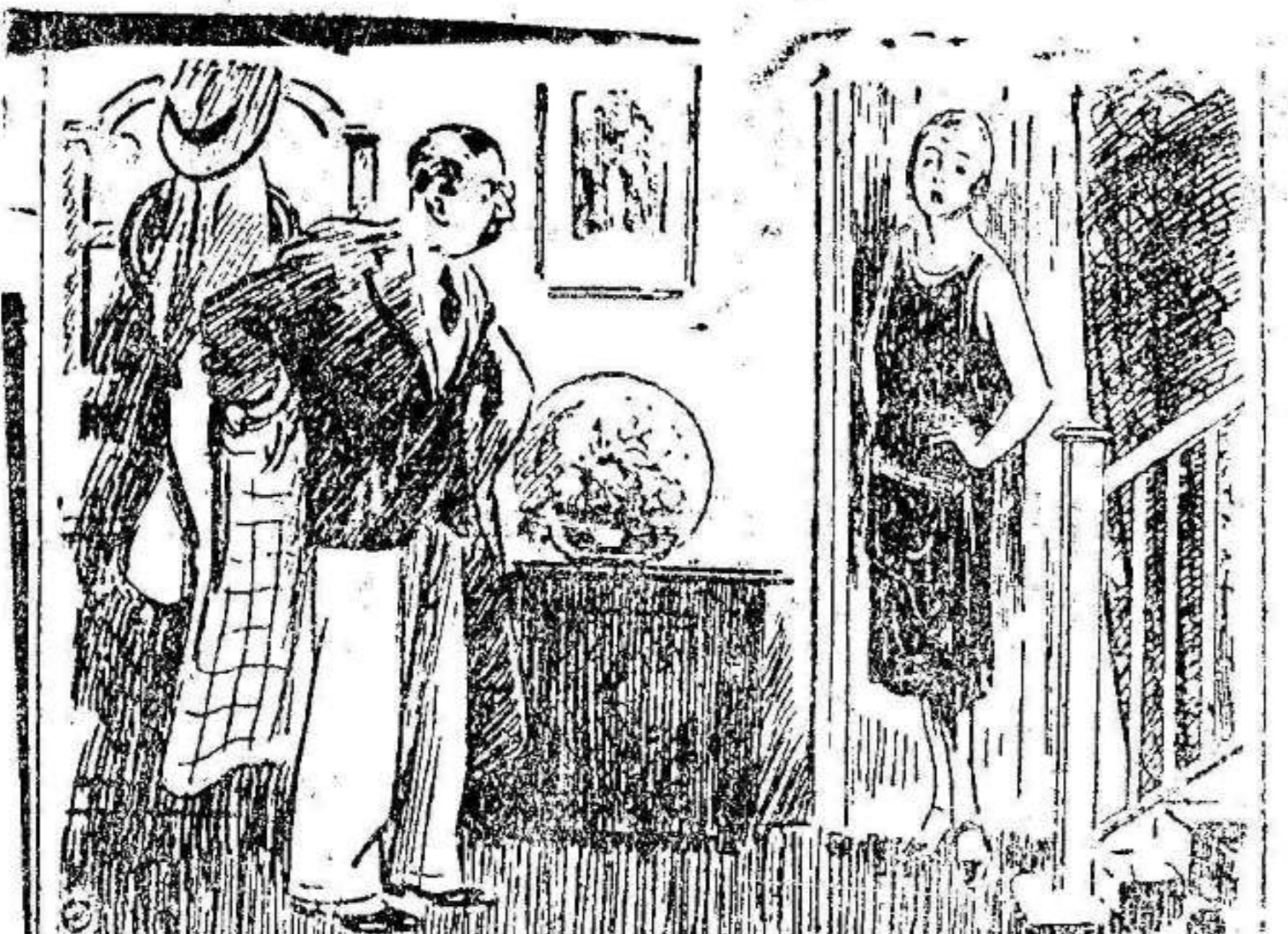
—Los hombres sois así... Se os dice una cosa y por un oído os entra y por el otro os sale.

Es indudable el paso de gigante que representa en la labor de propaganda de «Fomento de Turismo de Valencia» la concesión de esos floreros en los postes. Y ha de servir de estímulo a sus elementos el convencimiento de que su labor es