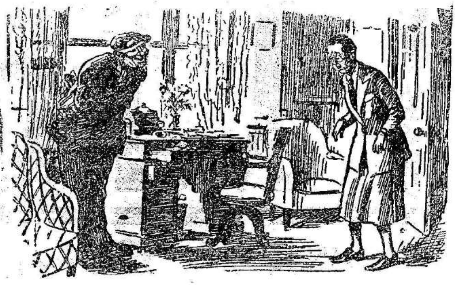
LA SEÑORA DE LA CASA.—¿Qué hace usted aquí? ¿No es usted el hombre a quien ví en la cárcel la semana pasada? EL LADRON.—Sí, señora; vengo a devolverle la visita.