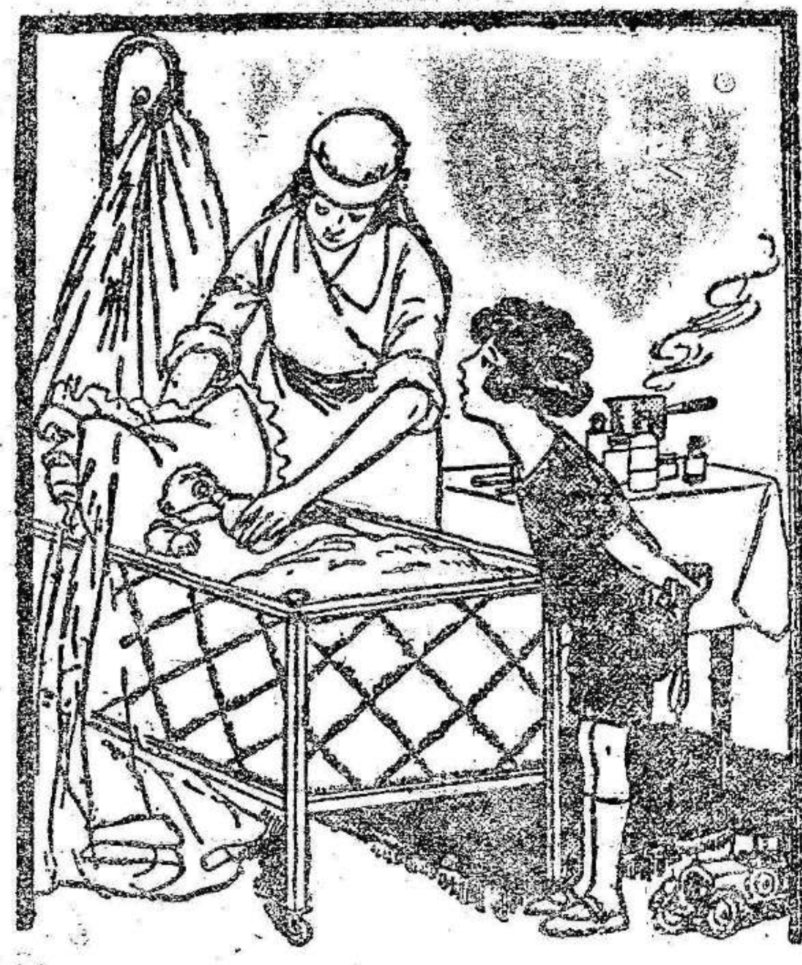
—¿Cómo se parece a papá! Tampoco tiene pelo en la cabeza!

obtenido extraordinario éxito el precio normal de 30 céntimos. «La Pantalla» En su número de esta semana publica: Portada e interviú con Jacques Castelain, Contraportada de Joan Crawford, Ecos de Madrid, Los estrenos en Broadway, «La sonrisa de los viejos», «La Pantalla» en los estudios Pathe Exchange Inc., Continuación del escenario de «La Venenosa», Congreso Español de Cinematografía, El Cinema en París, Hollywooderías, y sus habituales secciones de Buzón, Nuestros lectores dicen, Concursos, etc., etc. Diez y seis grandes páginas en huecograbado, 20 céntimos. Suscribese a EL LIBERAL 2 ptas. al mes