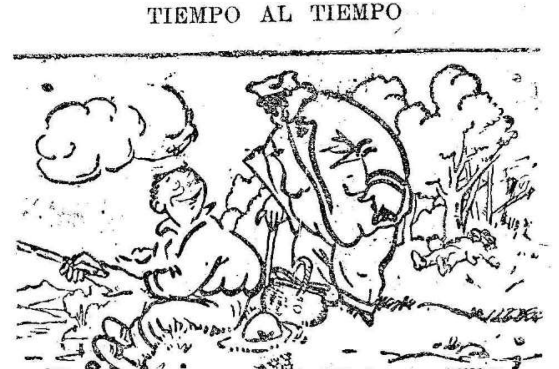
—¿Cuántos ha pescado? —Hombre, hace dos horas que estoy aquí y ya quiere que haya pescado alguno?