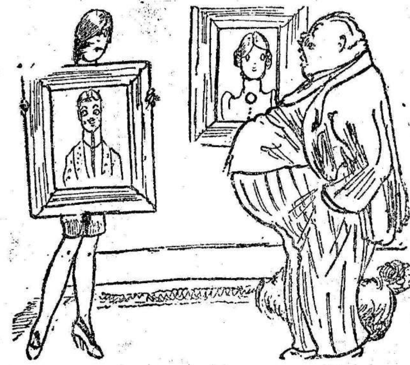
—¿Y cómo quieres, papá, que yo me case con un hombre así?... (Sondagnisse-Strix)