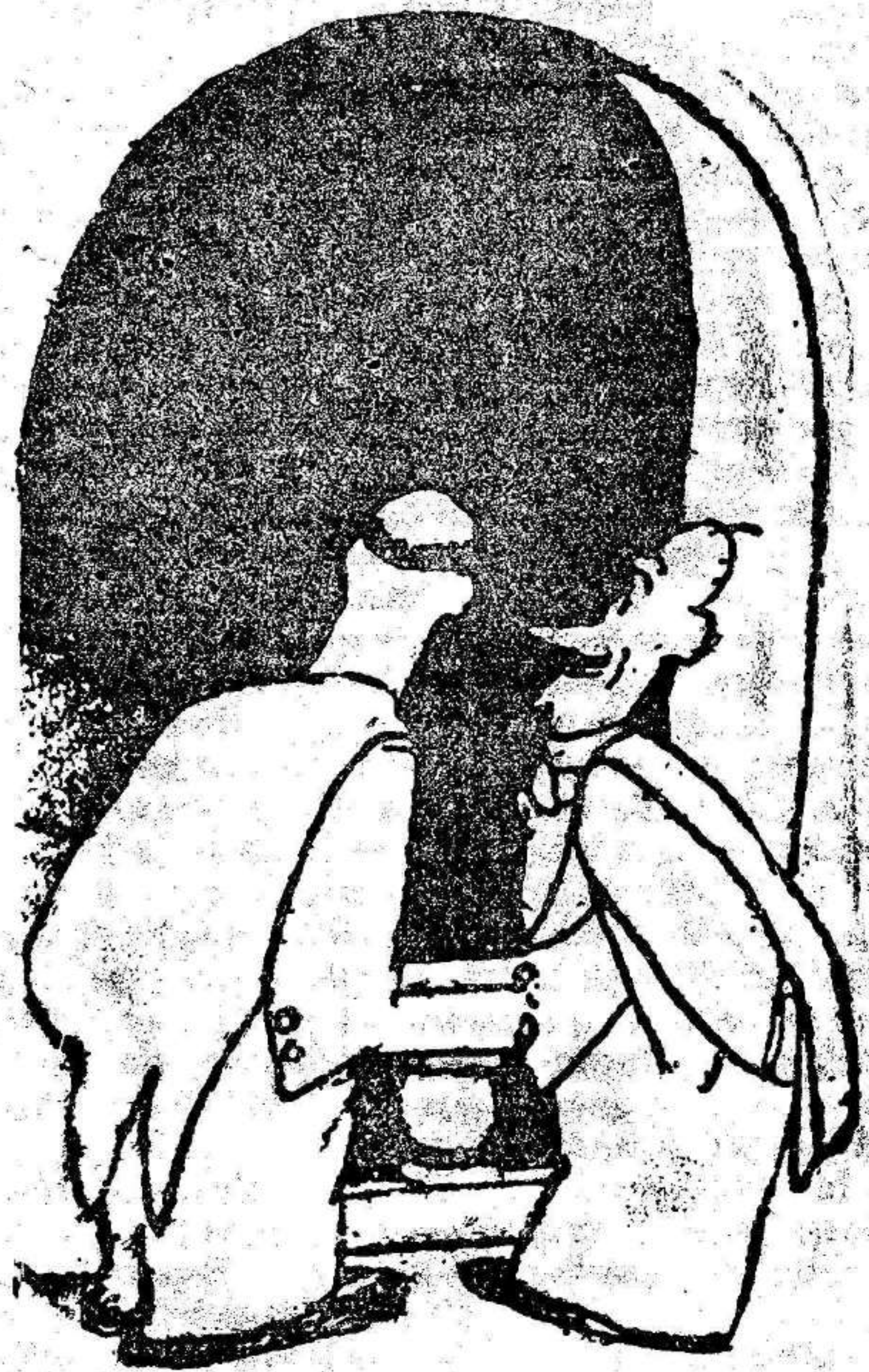
Amigo mío, estoy profundamente admirado no tanto del descubrimiento de esas estrellas, sino del hallazgo de los nombres con que han sido bautizadas.