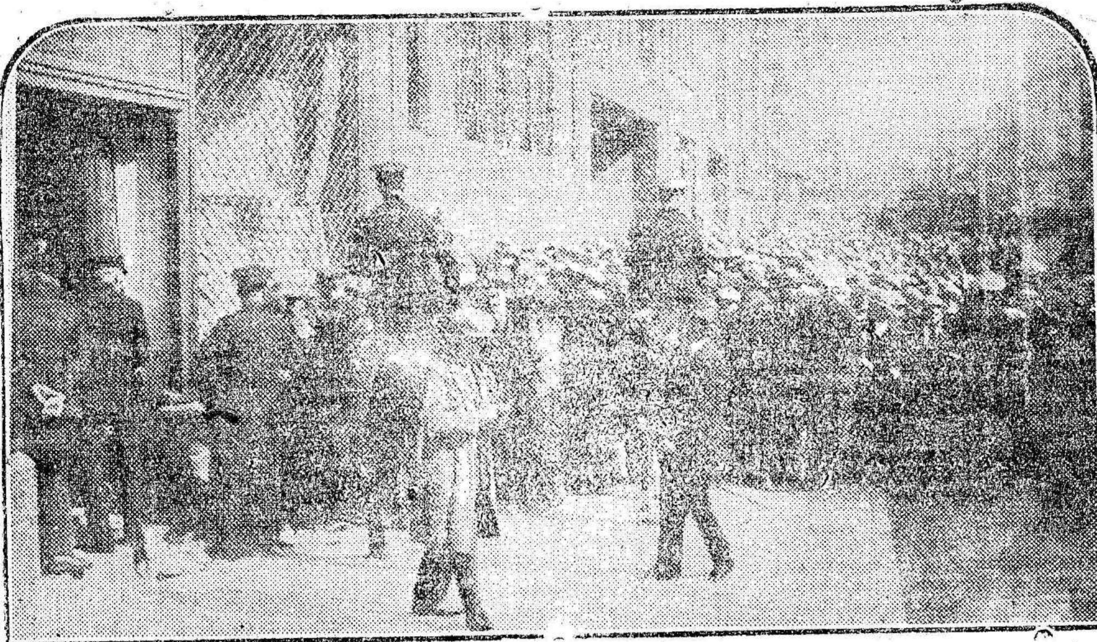
El prestigio que ante el mundo entero gozaba el fútbol español, hizo que apenas anunciada la fecha del encuentro entre nuestro equipo y el de Italia, el público se apresurara a obtener la localidad para presenciarlo, como puede apreciarse en esta fotografía que nos muestra a la muchedumbre agolpada ante las taquillas.

La desastrosa actuación del seleccionador nacional, junto al pobre juego desplegado por nuestro equipo en el segundo partido con el italiano, ha hecho que nuestro prestigio futbolístico decaiga por la torpeza de no enviar un equipo completo.