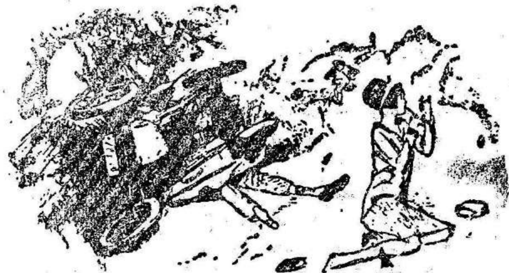
Los primeros socorros.