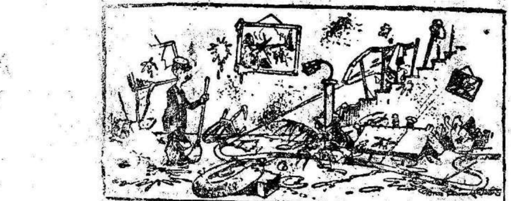
El estudio de una casa cinematográfica, después de representarse una comedia sentimental.