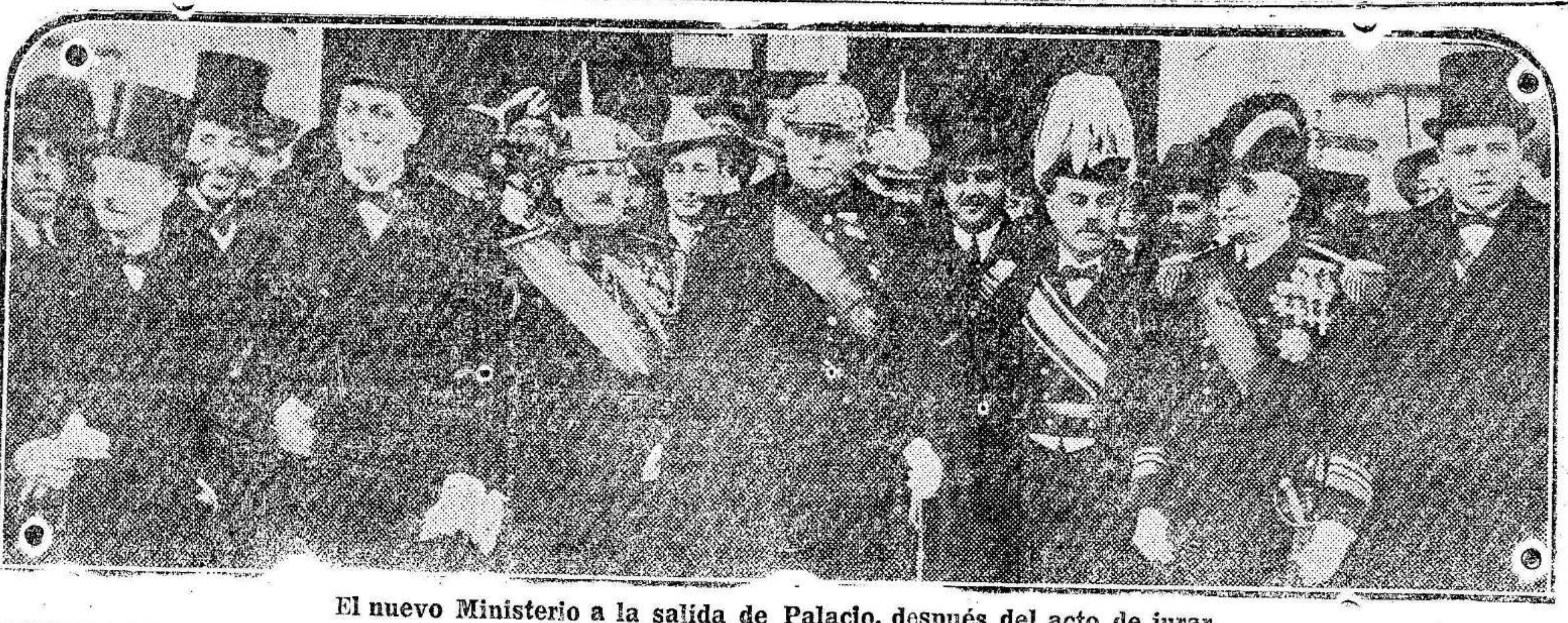
El nuevo Ministerio a la salida de Palacio, después del acto de jurar