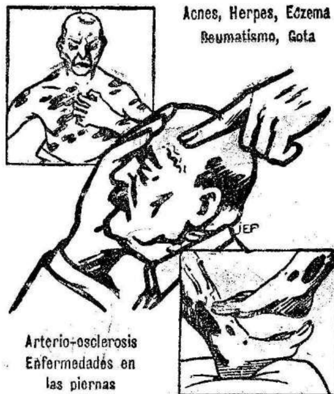
Acnes, Herpes, Eczema, Reumatismo, Gota