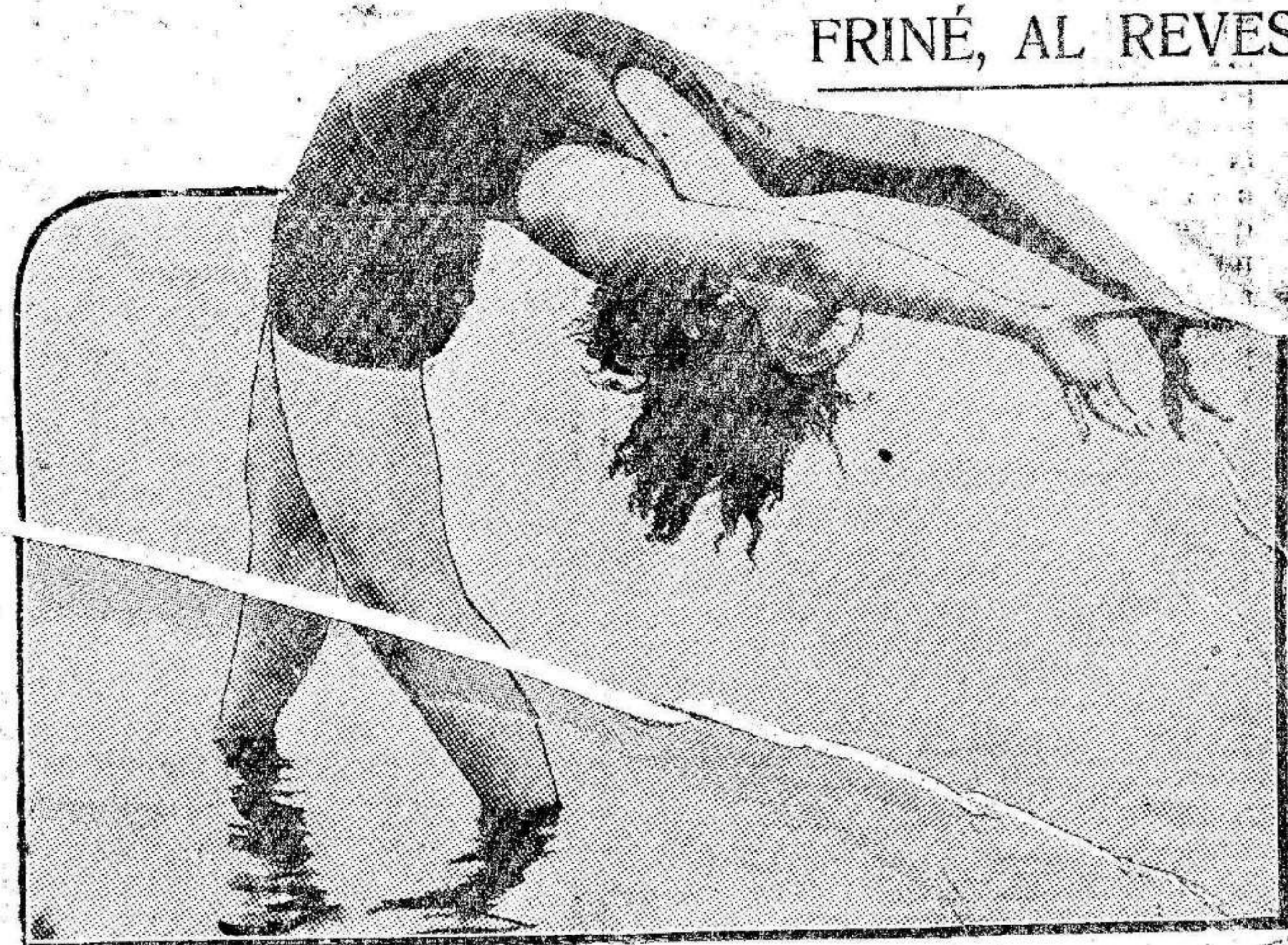
FRINÉ, AL REVÉS. Hace tiempo, en Grecia, una señorita—la señorita Friné—ya saben ustedes los estragos que hizo saliendo de una manera artística del baño. La joven cuya silueta tenemos el gusto de presentar encima de estos renglones quizá no conozca la aventura de Friné con los probos funcionarios de la Magistratura encargados de juzgarla; pero si se la conoce, la intuye. Y quiere repetirla Mejor dicho, quiere parodiarla. Si Friné sedujo al salir del baño, ella quiere seducir al entrar. Convergamos, lector amigo, que lo consigue. Viéndola lanzarse a las saladas ondas verdad, querido lector, que se despierta en uno, irrefrenable, irreflexionable, la vocación de buzo?

Con razón el colega está en auge. ¡Nada menos que dos vapores, señor!