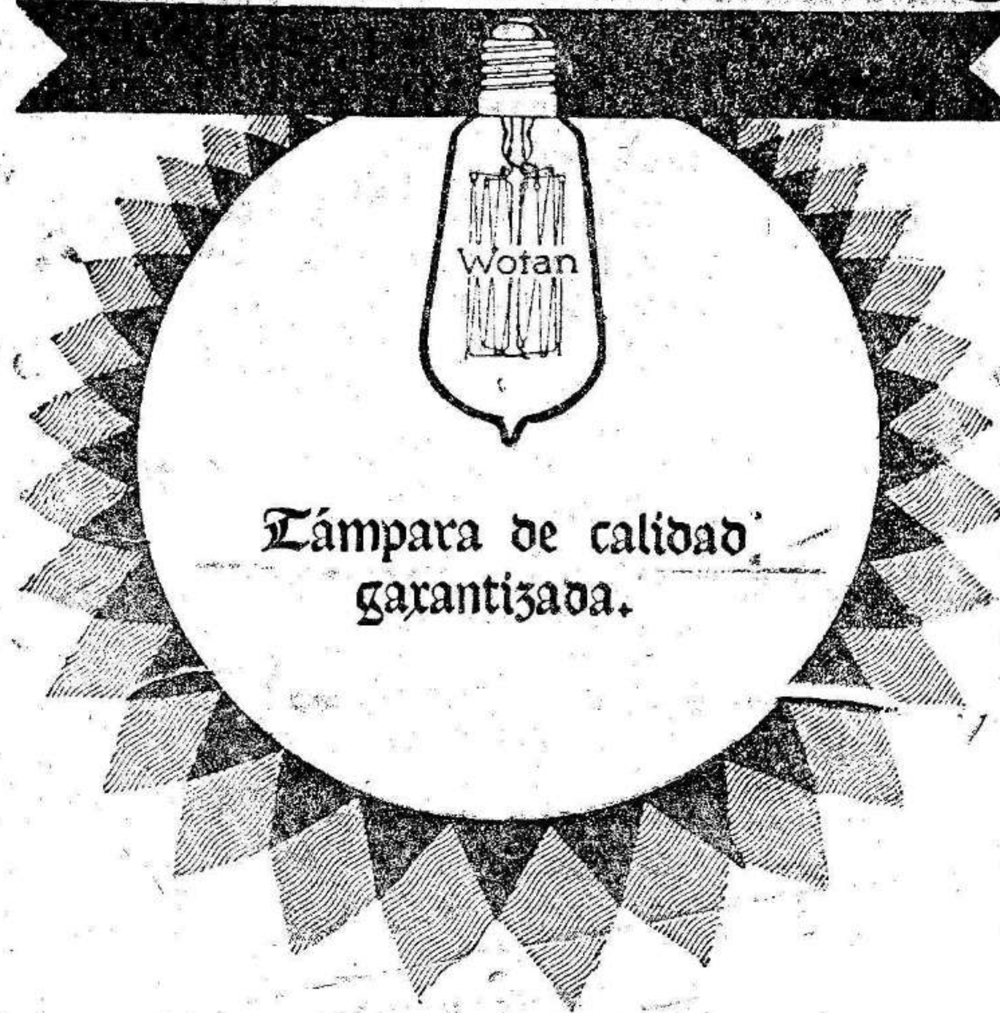
Lámpara de calidad garantizada.

De venta en Murcia: Centro Industrial Electro-Químico-Agrícola Plaza Fontes, num. 1.