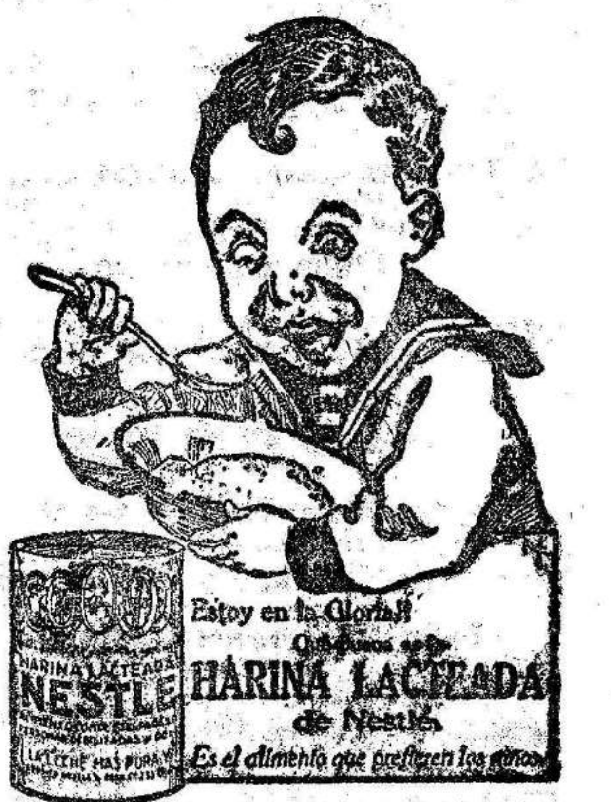
Muestras y folletos, gratis, a quien lo solicite de la SOCIEDAD NESTLÉ. Gran Vía Layetana, 41, Barcelona.