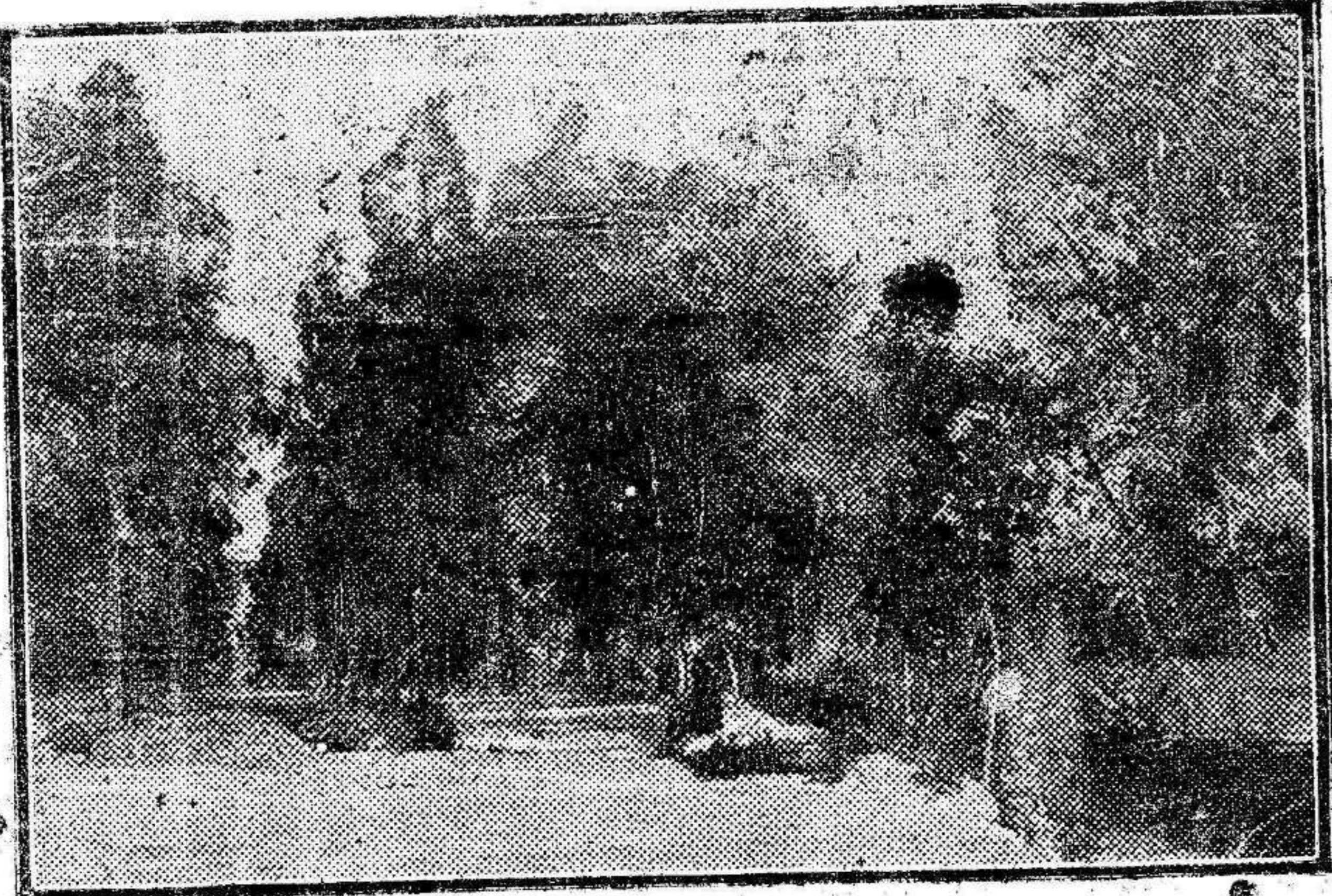
ABARAN.—Paseo del Parque