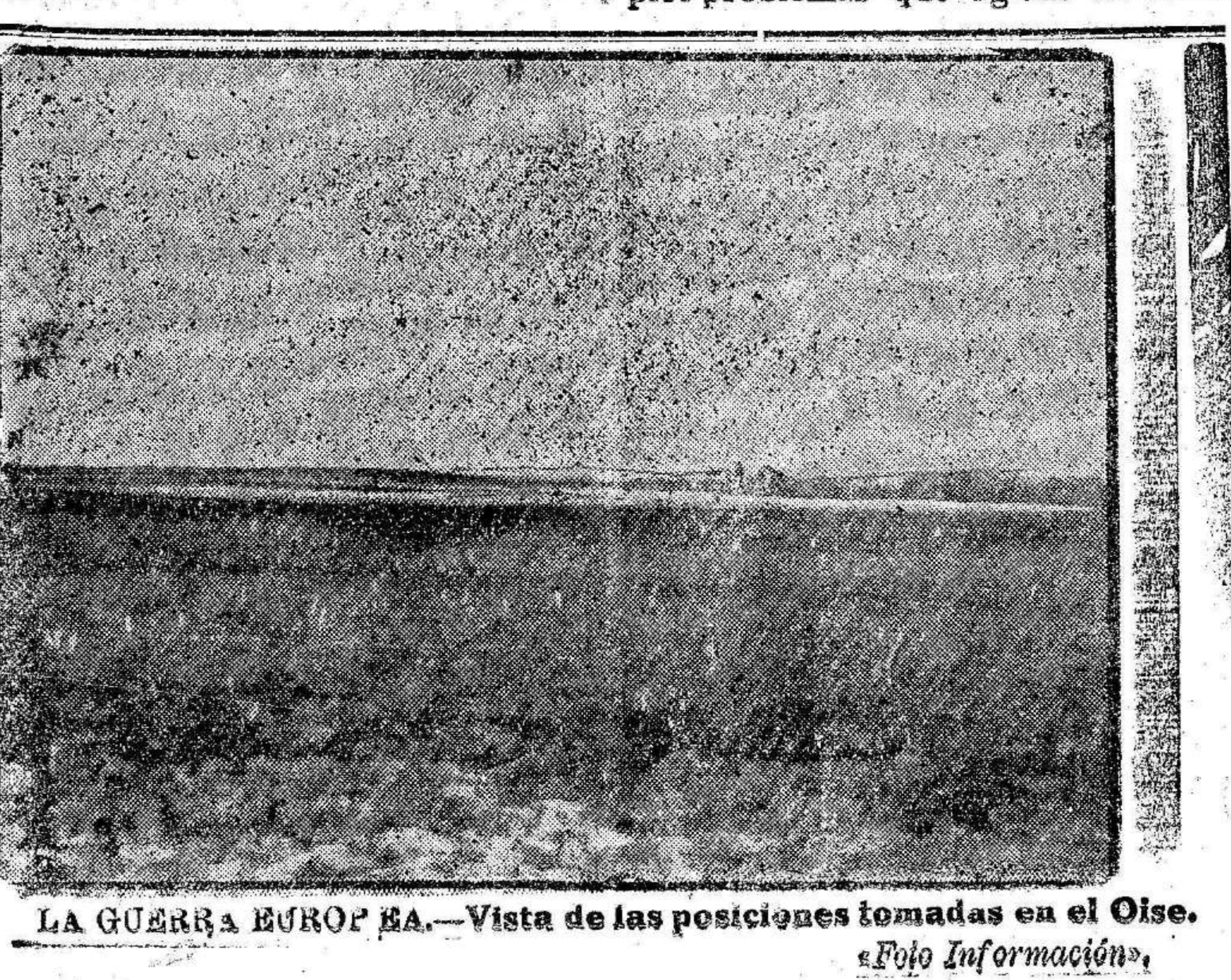
LA GUERRA EUROPEA.—Vista de las posiciones tomadas en el Oise.