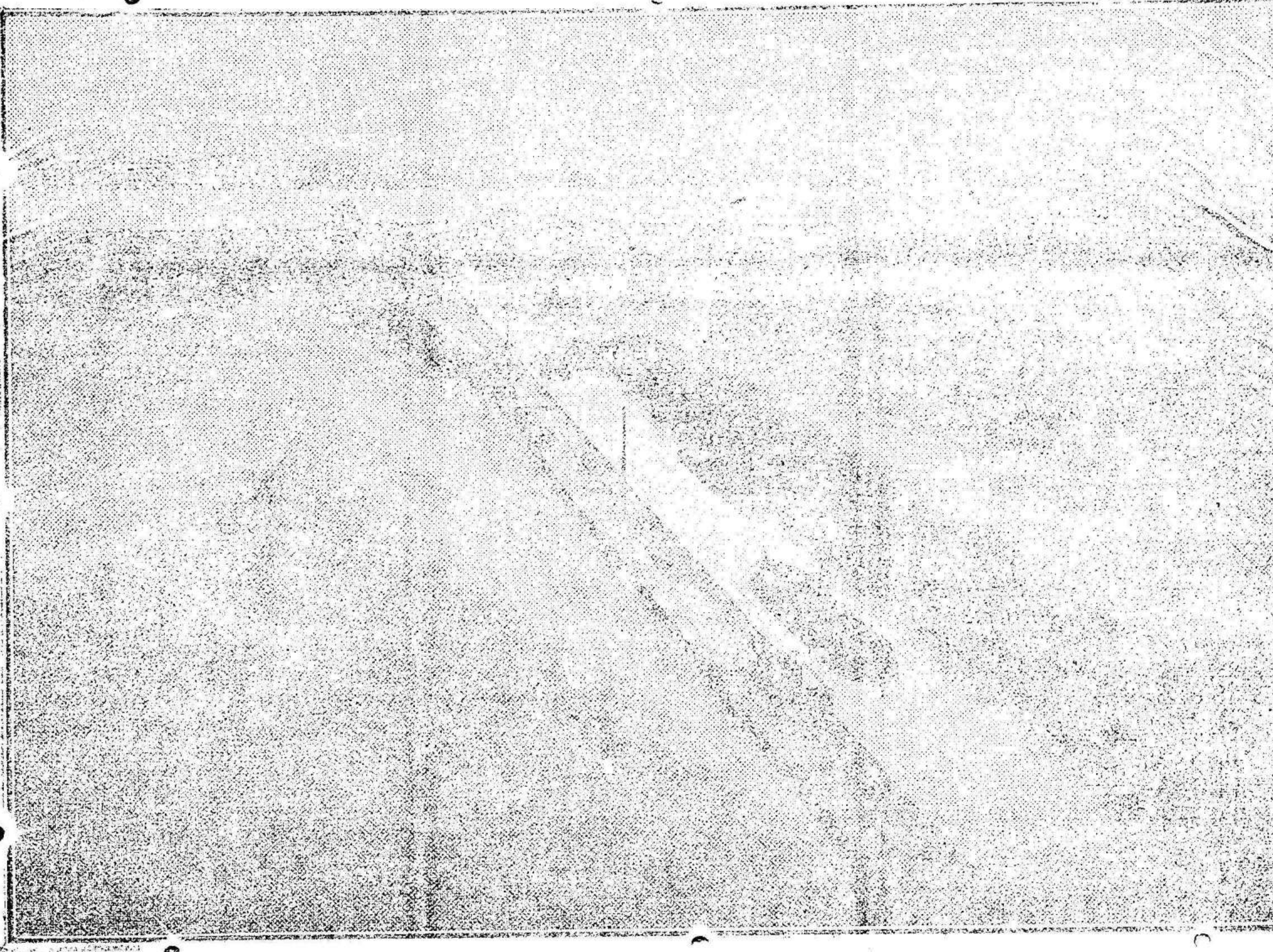
Vista parcial del dique 1.º—Depósitos de sal.—Lavadoras y Laguna