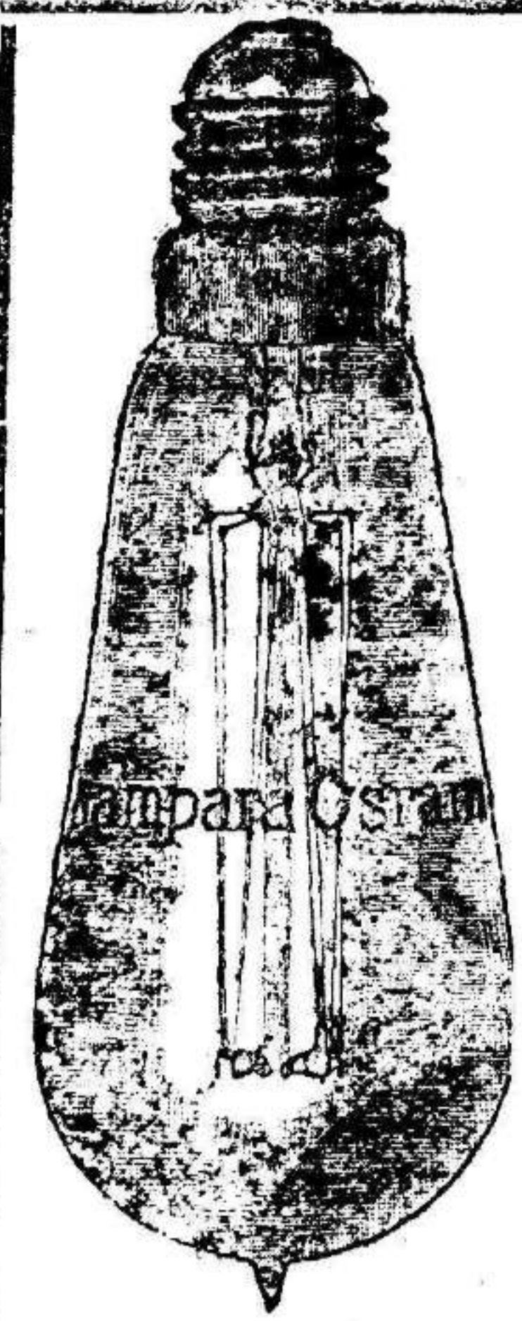
Una lámpara Osram de 20 bujías, consume igual que una lámpara corriente de 5 bujías.