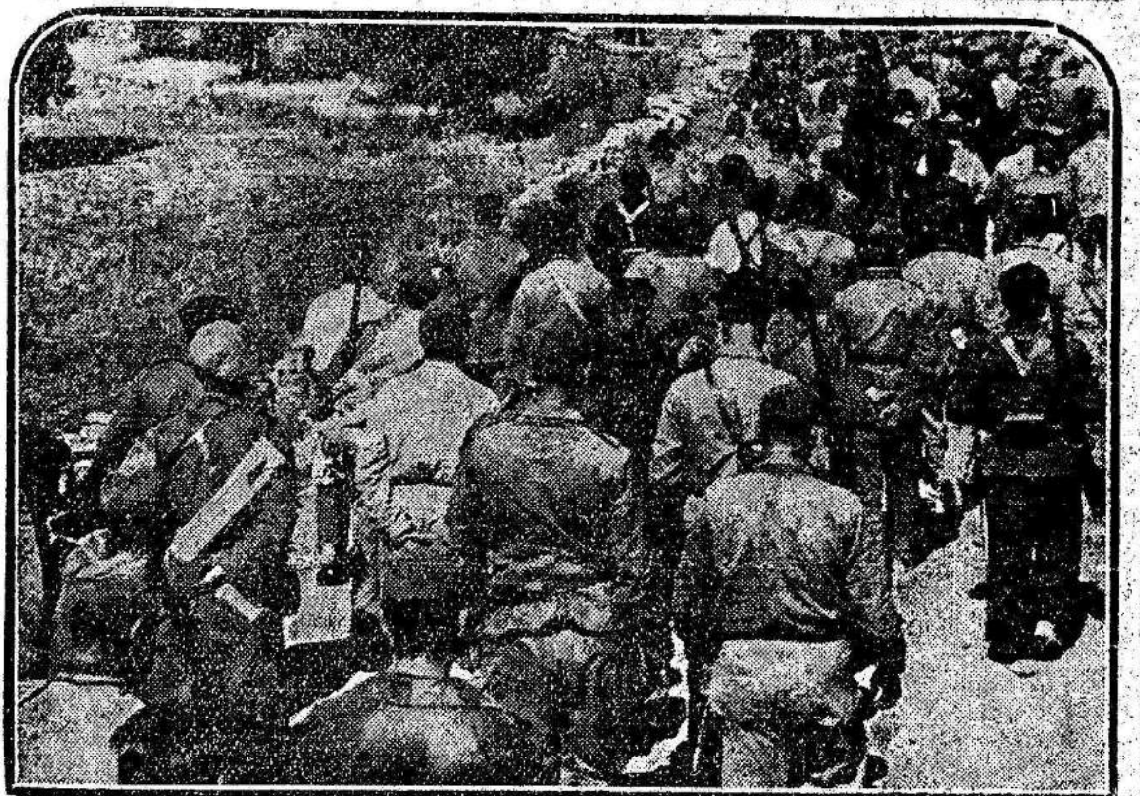
REBELDES PRISIONEROS.—Además del copioso material de guerra de que nuestras fuerzas se han apoderado al tomar Estrechoquinto, cayeron también en sus manos numerosos prisioneros. En la foto se ve un grupo de ellos, escoltado por las Milicias republicanas.

Las fortificaciones facciosas de Bargas han sido duramente castigadas, siendo la situación de los allí concentrados verdaderamente angustiosa.