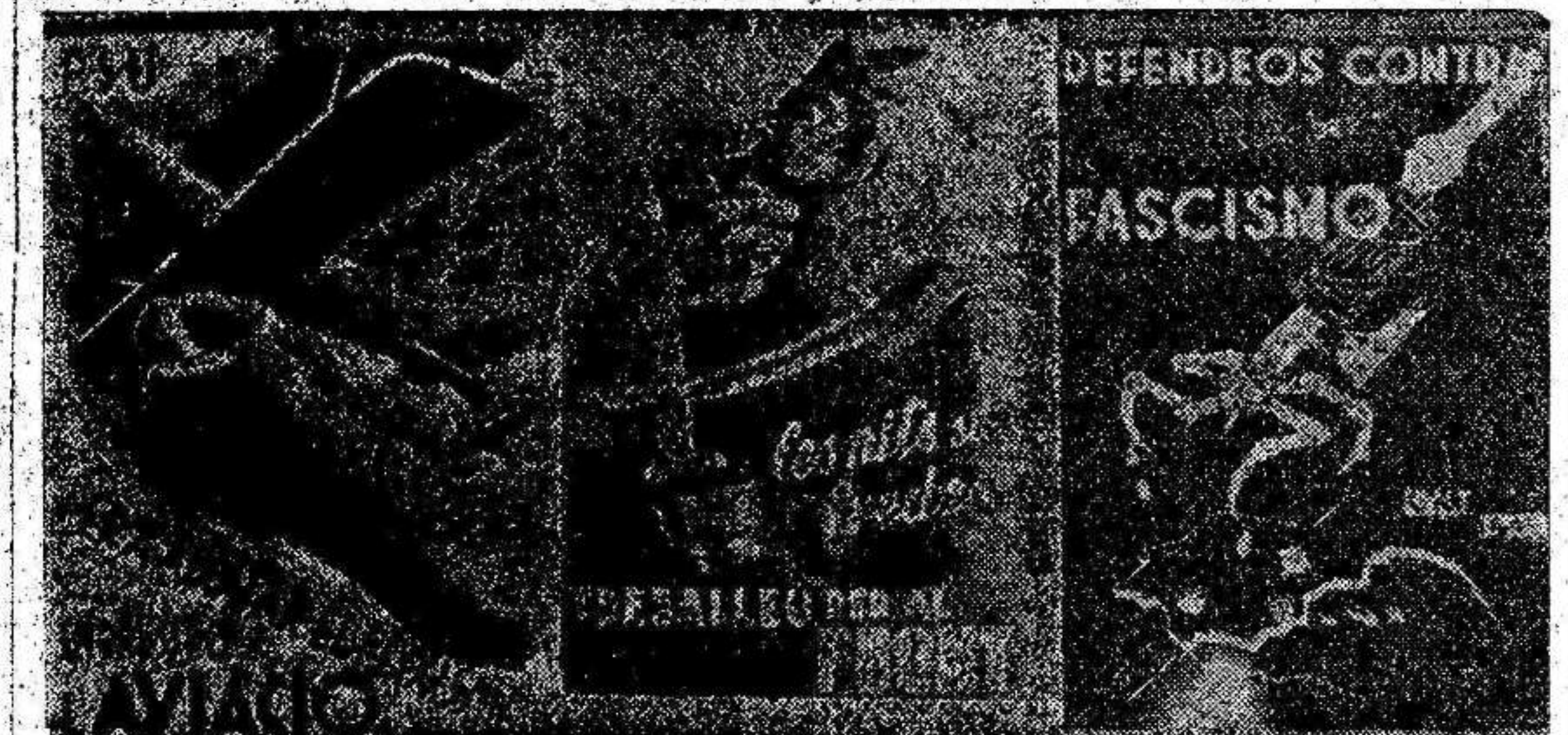
CARTELES EN BARCELONA. -- Cataluña, más española ahora que nunca, pone todo su esfuerzo y todos sus recursos en la titánica lucha empeñada contra el fascismo. Las calles de Barcelona están empapadas de carteles donde se requiere la colaboración de todos los ciudadanos. Véanse en nuestra foto algunas muestras.