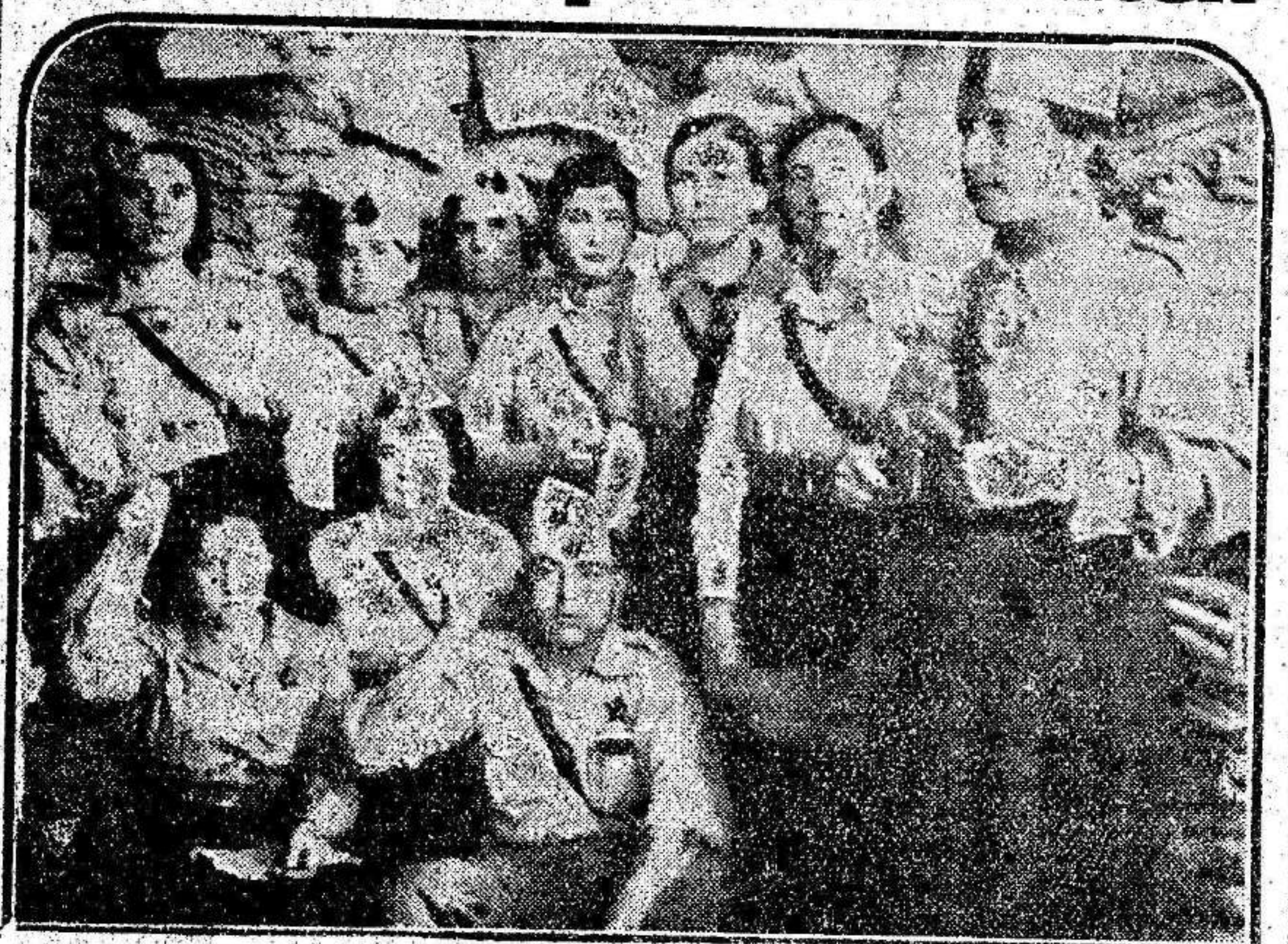
Un grupo de bellas muletas que han adquirido gran cantidad de ropa para los valientes milicianos que luchan en el frente contra el fascismo.

Unas cuantas muchachas de Mula, se propusieron realizar una obra digna de todo encomio: facilitar a los que luchan en favor de la causa popular, de aquellos elementos indispensables para su permanencia en las líneas de fuego, en el crudo tiempo que se avecina.