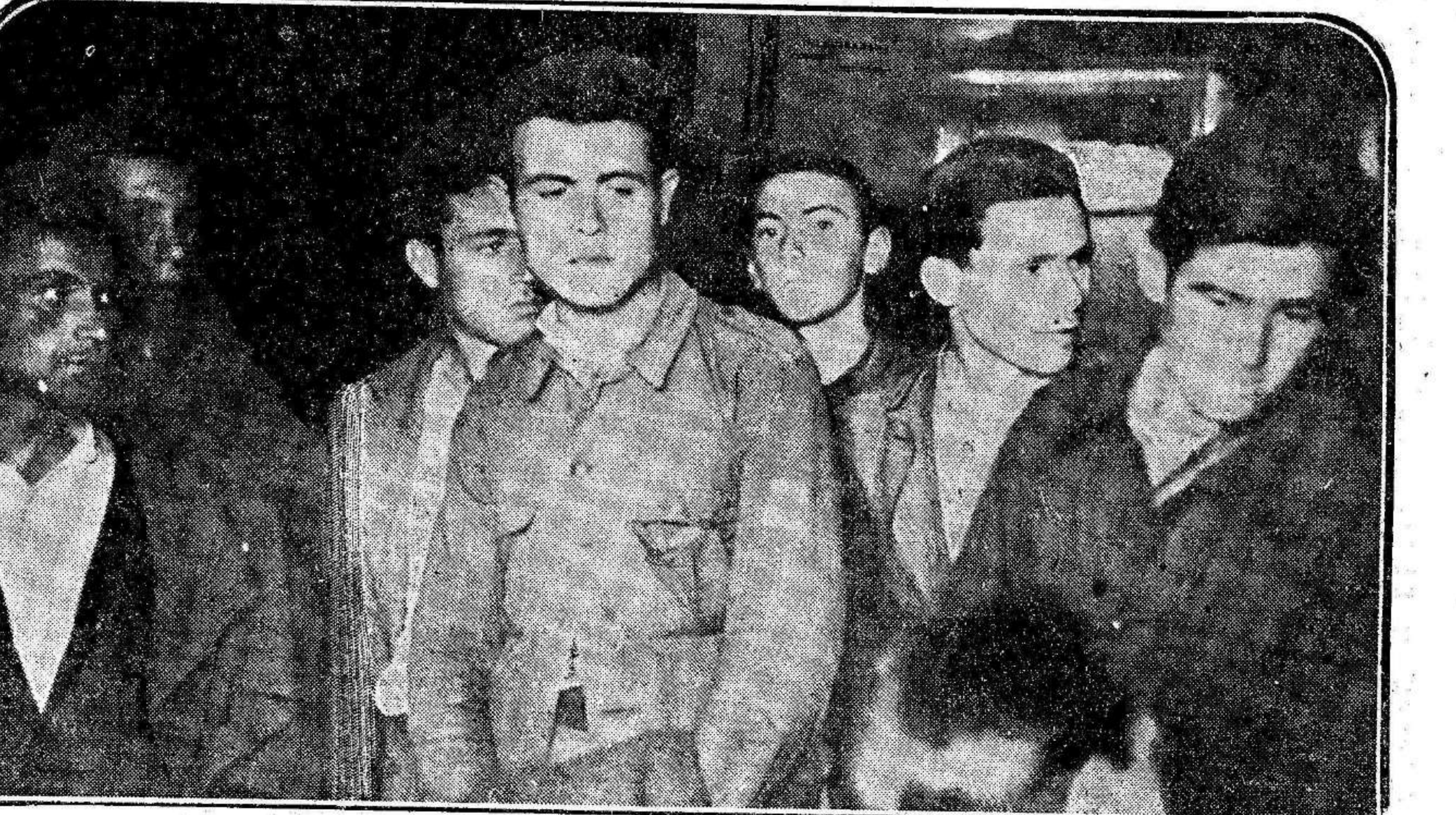
Un grupo de soldados que figuraban entre los sublevados en el cuartel de El Pardo, y que se ha pasado a las filas leales de la República.

MADRID.—El jefe del Gobierno, señor Giral, permaneció toda la mañana en el ministerio de la Guerra. También acudió a dicho ministerio el ministro de Hacienda, que conversó con los prodistas, anunciándoles que a las cinco de la tarde se reuniría el Consejo en el palacio de la Presidencia. VISITANTES DEL MINISTRO DE LA GUERRA MADRID.—El ministro de la Guerra, teniente coronel Sarabia, recibió la visita de los diputados socialistas Alvarez del Vayo, Vidarte y Matilde de la Torre. Manifestó a los informadores que para esta noche, a las diez, había convocado en el Ministerio, a una reunión, a todos los generales de la guarnición de Madrid.