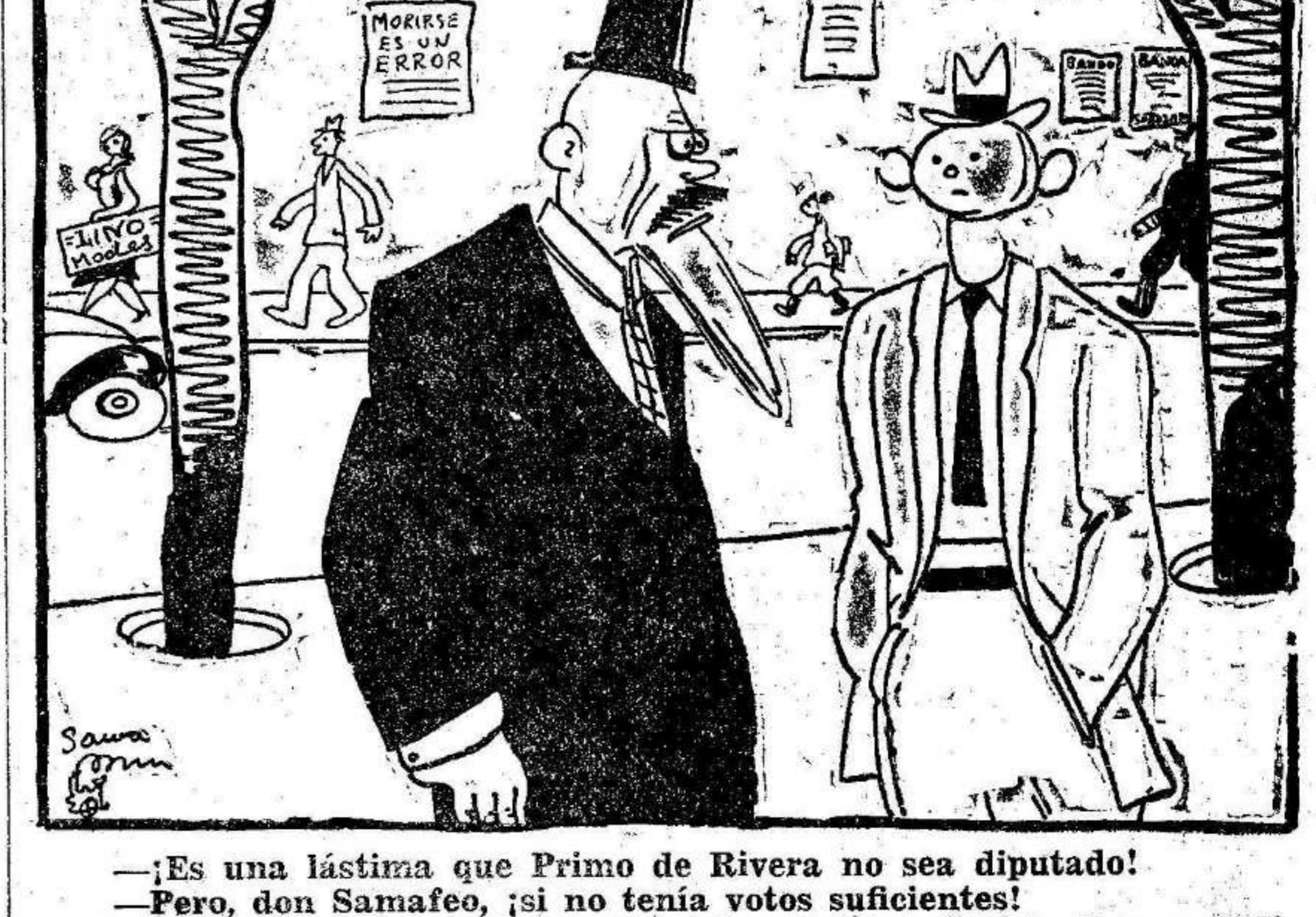
—Es una lástima que Primo de Rivera no sea diputado! —Pero, don Samafeo, ¿si no tenía votos suficientes! —¿Y qué? ¿Tampoco los tenía Calvo Sotelo, y ahí lo tiene usted!