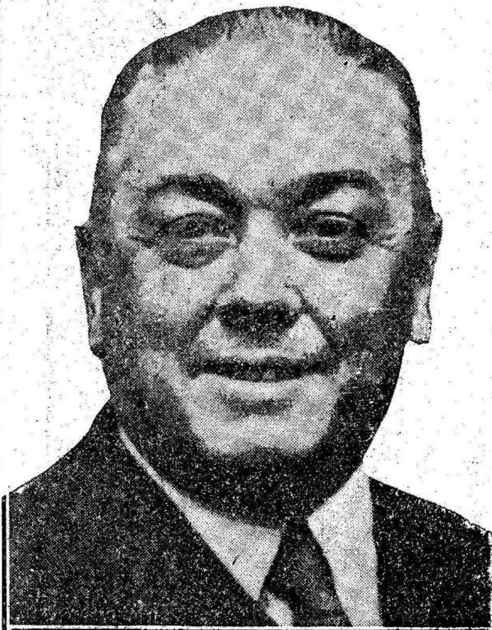
Don Diego Martínez Barrio ejerce transitoriamente la primera magistratura del país. Elevado a este puesto preeminente por mandato constitucional, al destituir el Parlamento al primer Presidente de la República, representa con pleno prestigio en el Palacio Nacional el triunfo de la soberanía popular y el poder del pueblo por encima de todos los poderes y es un ejemplo de cómo se reconocen los méritos que en España contraen los buenos españoles.