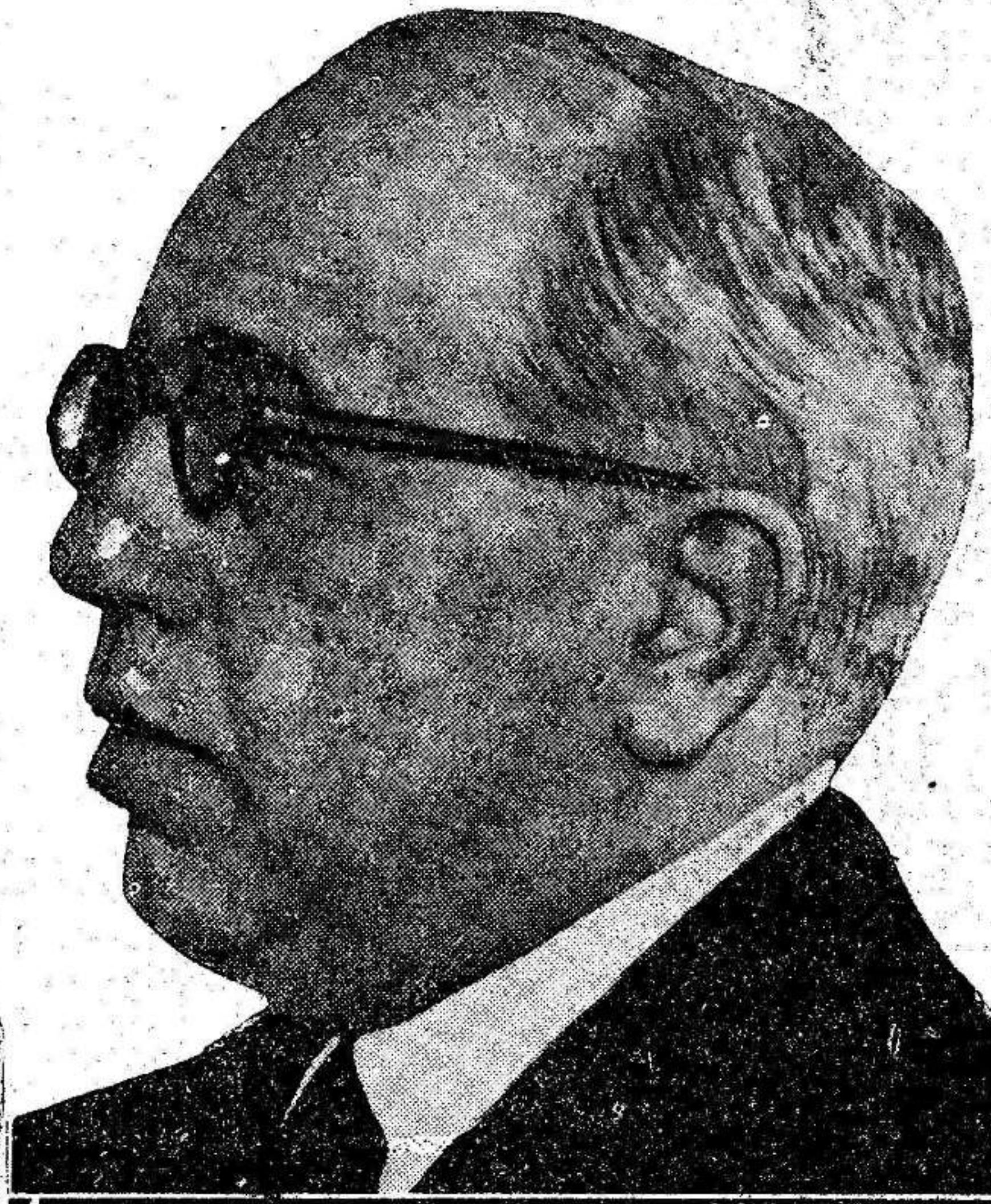
En el quinto aniversario del advenimiento del Régimen, vemos esperanzados que en la poltrona presidencial hay una voluntad inquebrantable y una inteligencia privilegiada, puestas al servicio de la Nación. Don Manuel Azaña y Díaz, depositario de la fe de un gran pueblo, es el baluarte inmovible contra el que se estrellarán las asechanzas, las traiciones, de que se quiere hacer víctima a la República que España abrazó el glorioso 14 de abril.