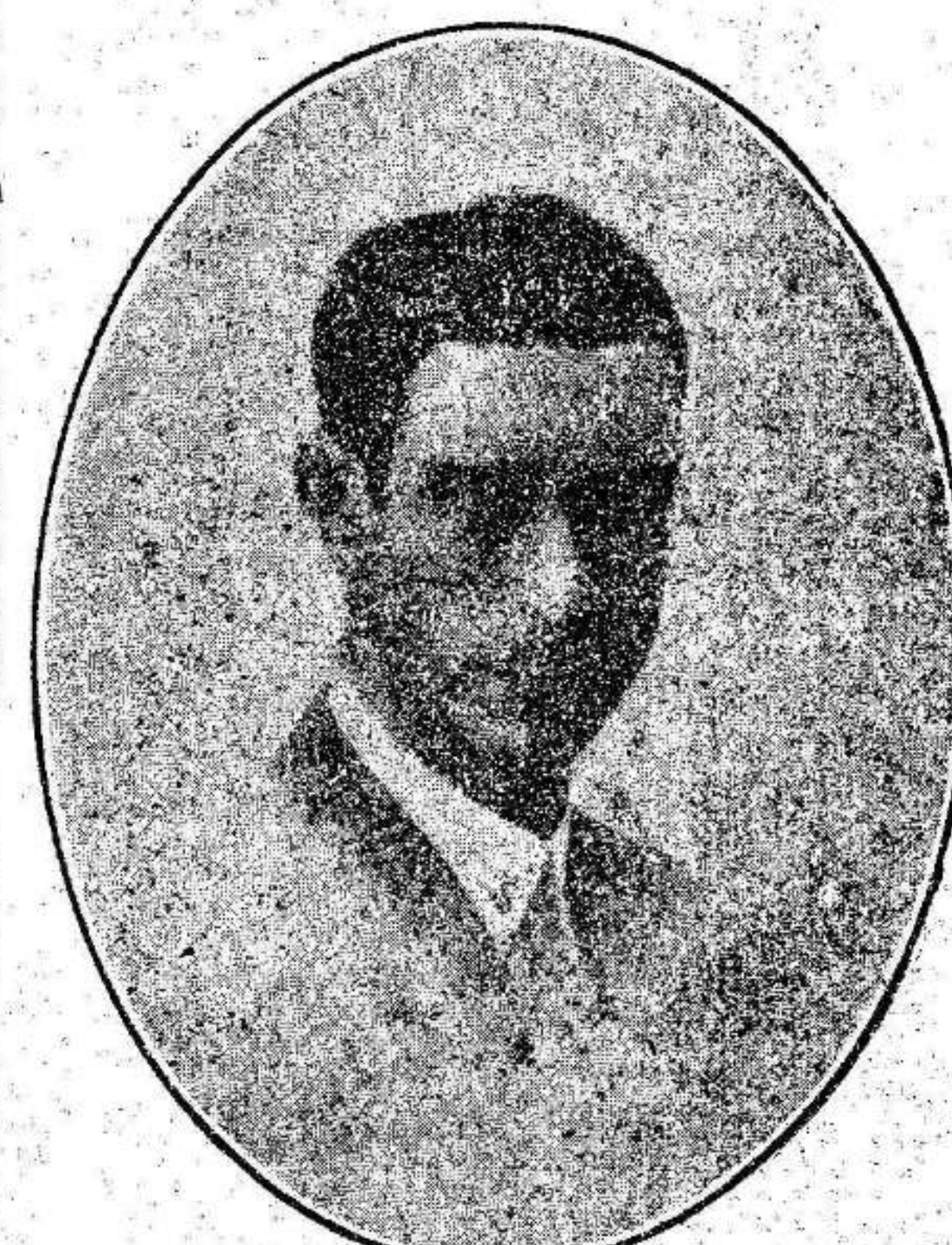
El Excmo. señor don Adolfo Silván Figuera, gobernador civil de la provincia.

El 14 de abril, fué para mí el día más emocionante de mi vida. Era el establecimiento de un régimen por el que había luchado desde niño.