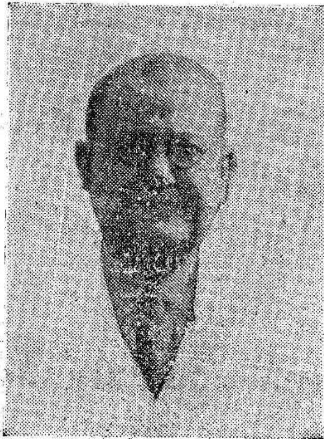
Don José María Escalzo, alcalde de Murcia.