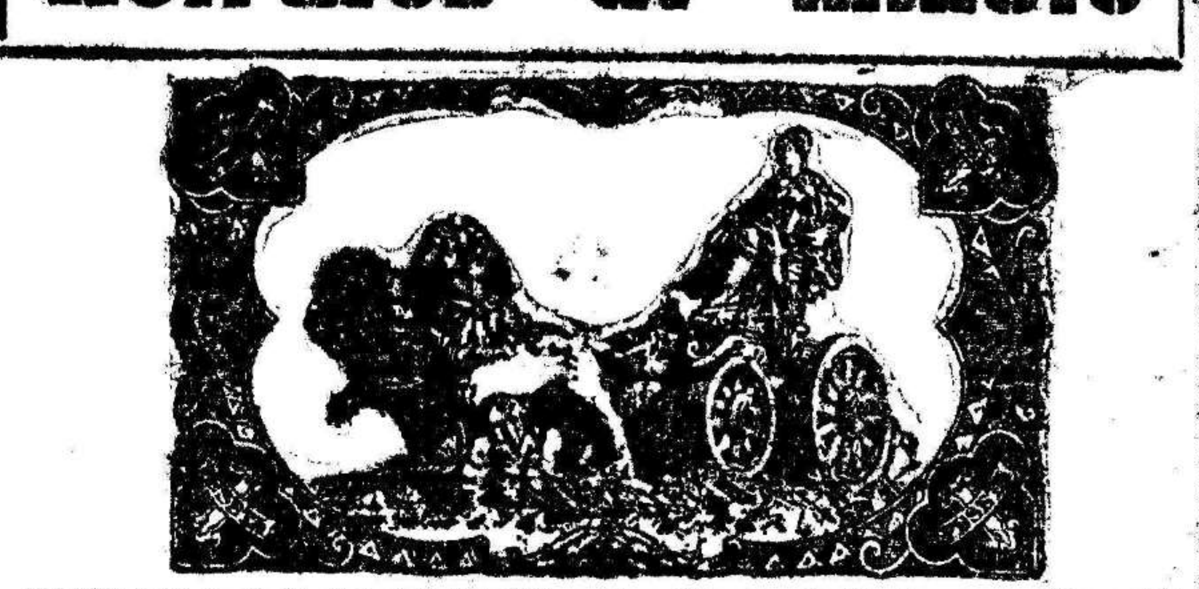
¡Y así está la linda tapeta! La Cibe... un ejemplo, desde luego, incómovible. les. Sigue en su sitio. No se mueve. Es... Como debemos ser todos.

¡Anda! Pues aquí tenemos a uno de los del "barullo". Mi maquinista es así. No se le ha traído nada más que von Ribbentrop. No se donde le habéis encontrado. Porque parece descendiente del "Judío errante". Está constantemente en viaje. El record de sus viajes no se le puede disputar más que a Delbos. El caso es que los de Delbos son para arreglar bien algunas cosas, por ejemplo, la de la Pequeña Estante y los de este tipo de cam de pato son todo lo contrario. Es decir, desarrugar el mundo. Como lo están haciendo polvo entre su amo Hitler y el compinche de éste Mussolini. Bueno, no está mal. Así queda el retrato para que conozcan a ese ciudadano en todos los grandes expresos europeos. Y le tratan como mereca.