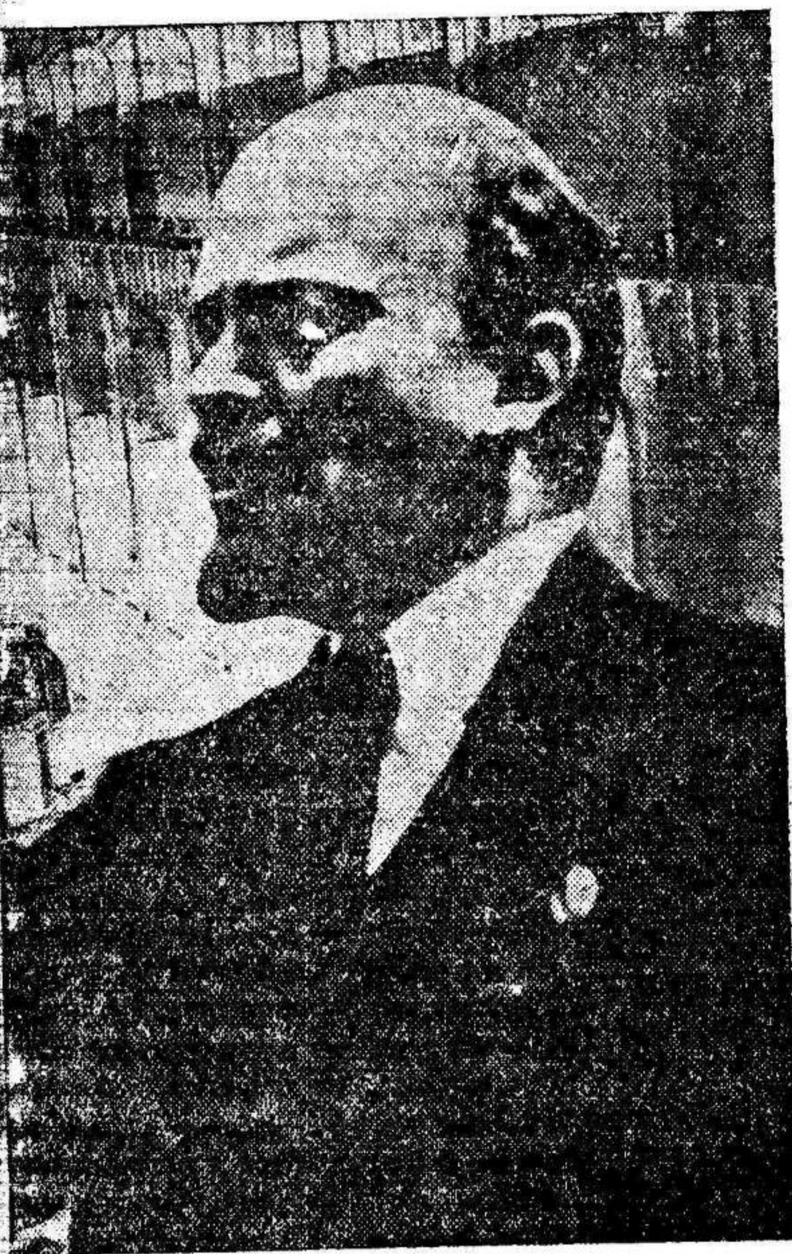
Los Generales Zaristas—escribió a los obreros soldados rojos de Petrogrado—han recibido, una vez más, municiones y material de guerra de los capitalistas de

El 13 de octubre de 1919 el Comité Central del Partido Comunista ruso decidió: "No entregar Petrogrado, retirar el máximo de fuerzas del frente Norte para defender Petrogrado y acudir en ayuda de la Capital, enviándole cierta cantidad de caballería". Inmediatamente el Comité Central del Partido indicó que había que ver los problemas de los frentes desde el punto de vista de la seguridad de Moscú, al Sur y Petrogrado, al Oeste. Lenin, con genial sencillez, descubrió el fondo de la táctica política y militar del