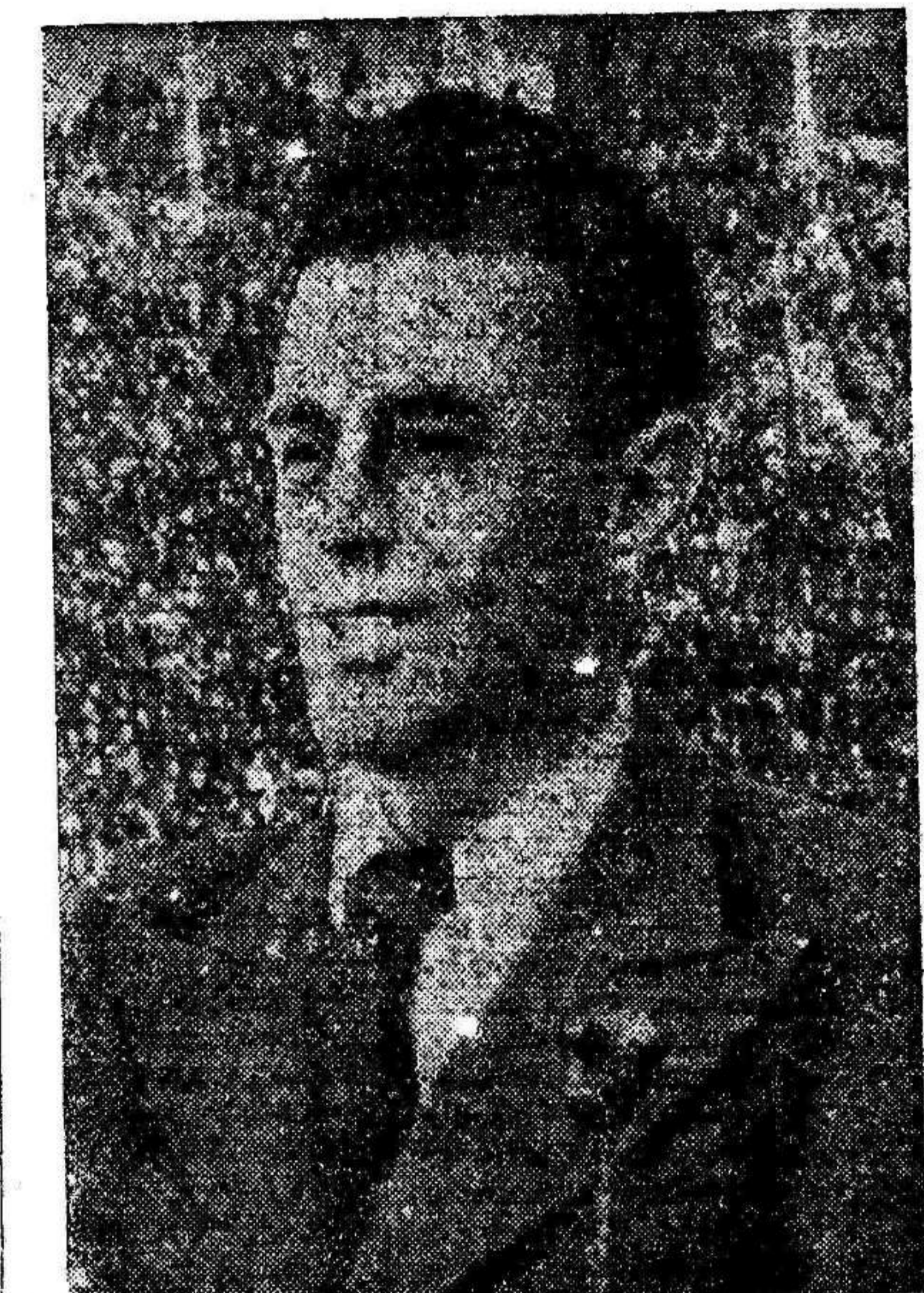
se van a tomar todas las medidas de organización para que Madrid sea la tumba del fascismo.

"Es en Madrid donde se va a desarrollar una de las batallas más decisivas de la guerra civil en España, yo estoy seguro que venceremos; porque habrá disciplina y porque