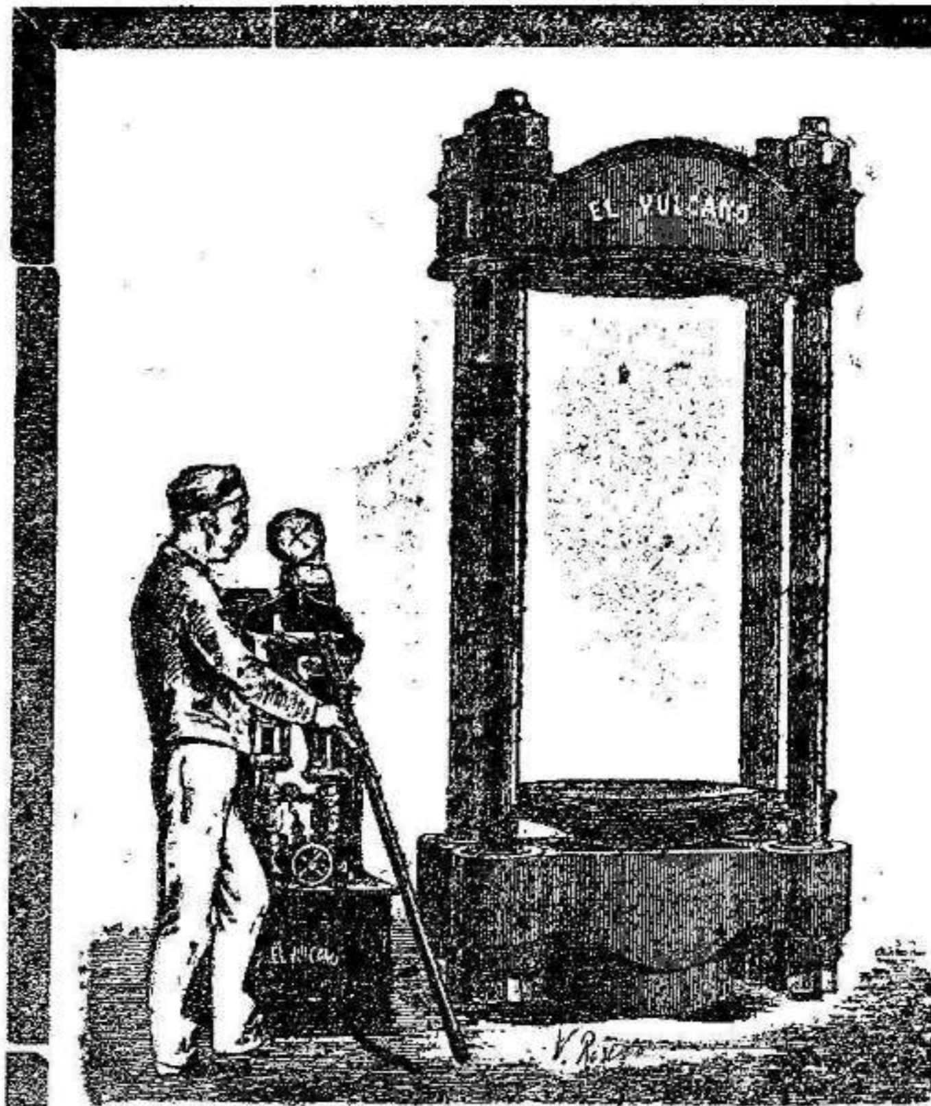
OFICINAS: P. PELOTA, 6. TALLERES: C. ORILLA DEL RIO, 16.