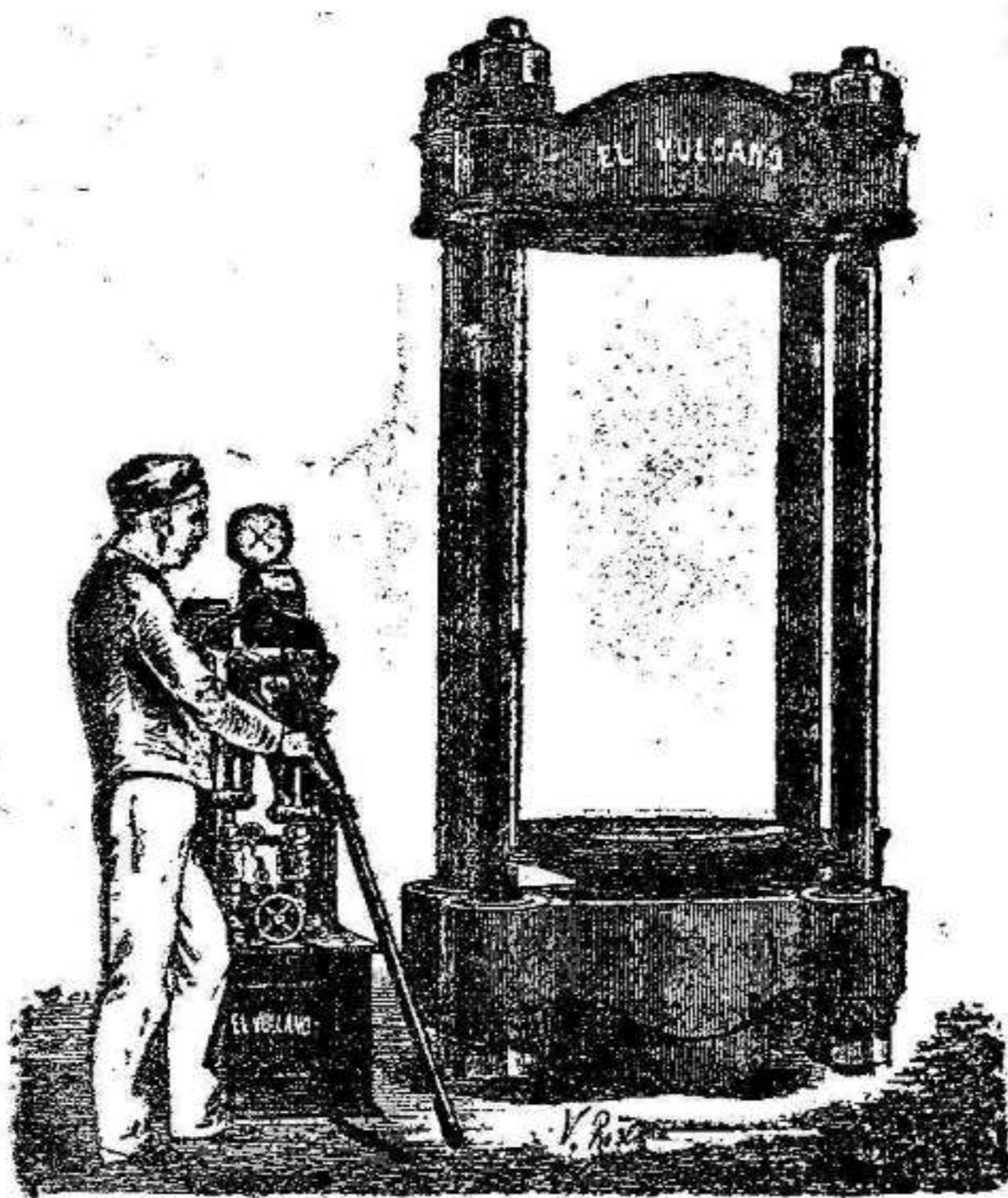
OFICINAS: P. PELOTA, 6. TALLERES: C. ORILLA DEL RIO, 16.