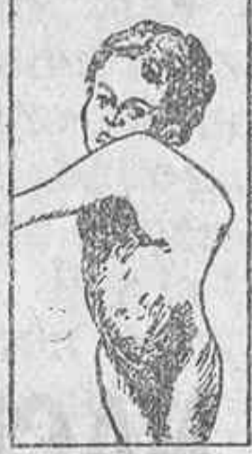
VALVULO-POTT y CIBROSIDAD