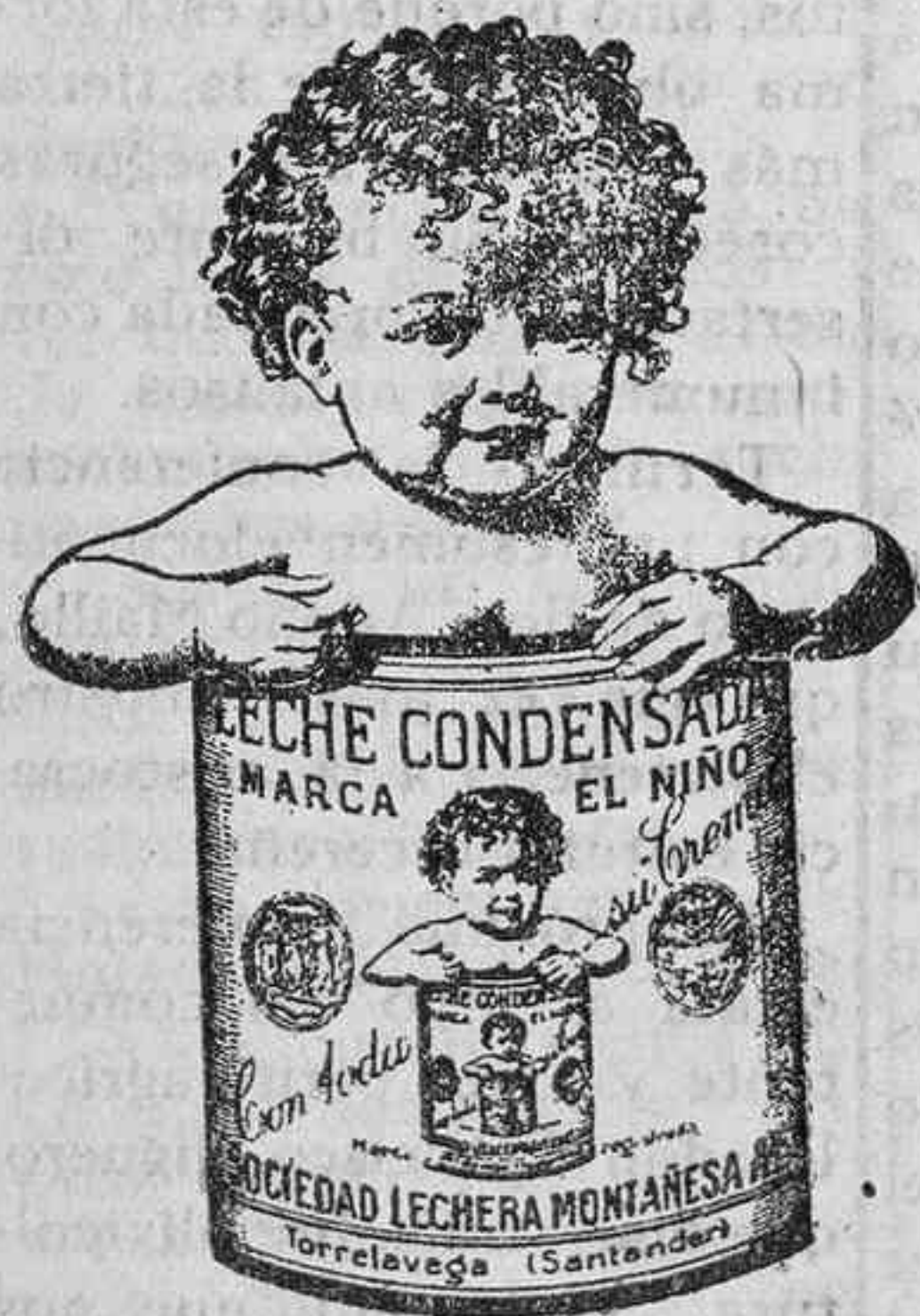
Leche «EL NIÑO» es la mejor en calidad y sabor