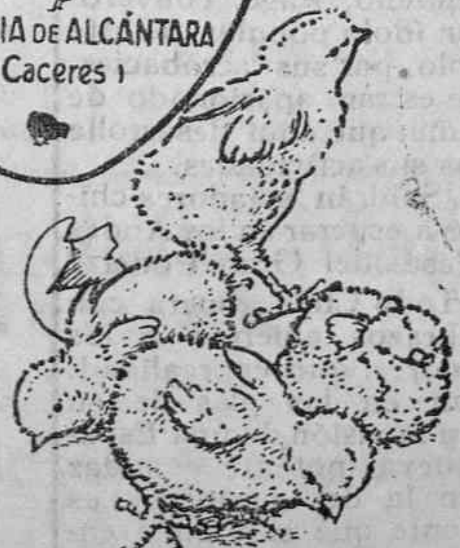
Polluelos recién nacidos