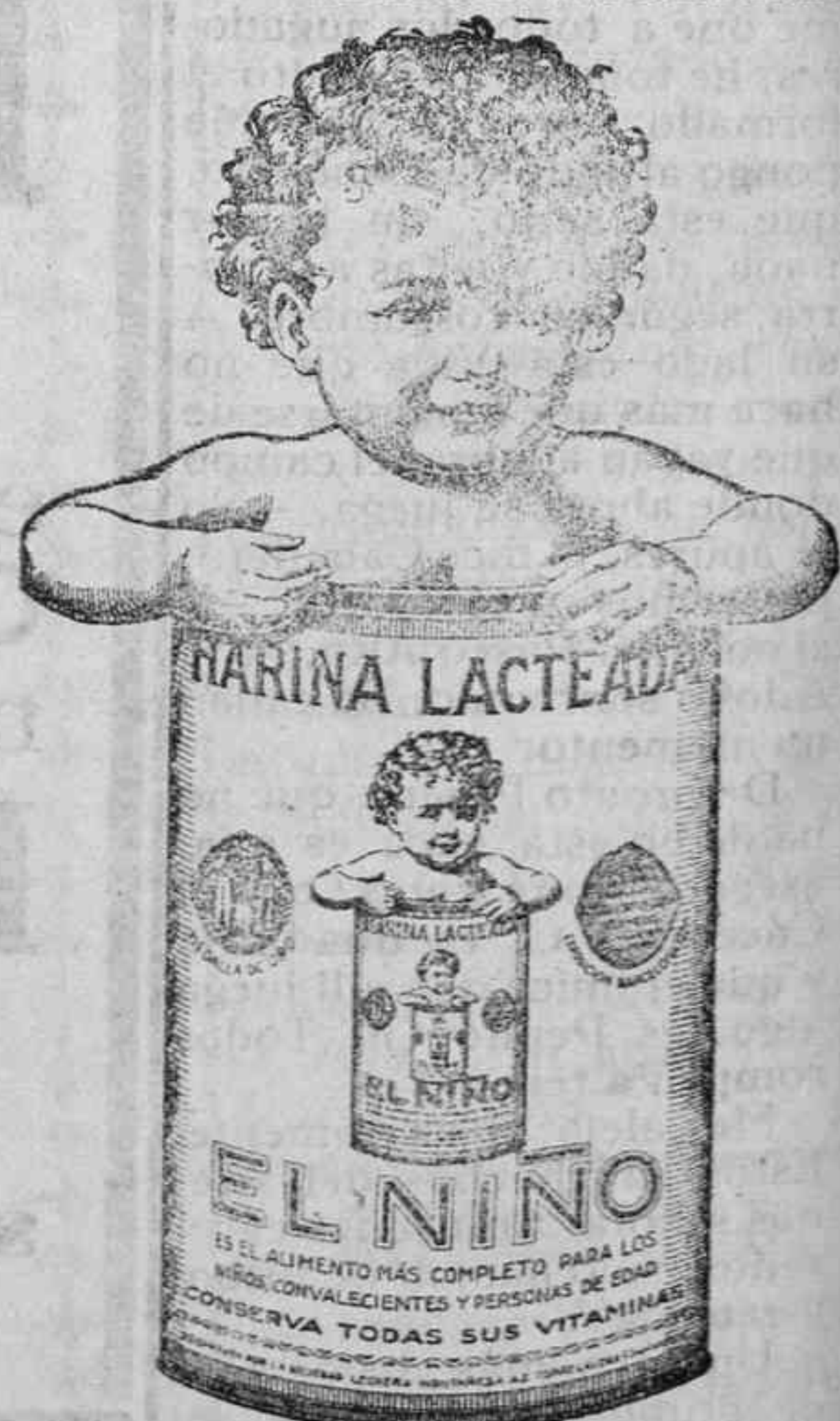
Harina «EL NIÑO» es la mejor en calidad y sabor