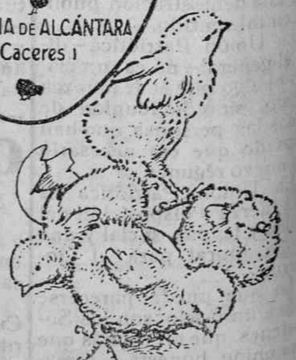
Polluelos recién nacidos