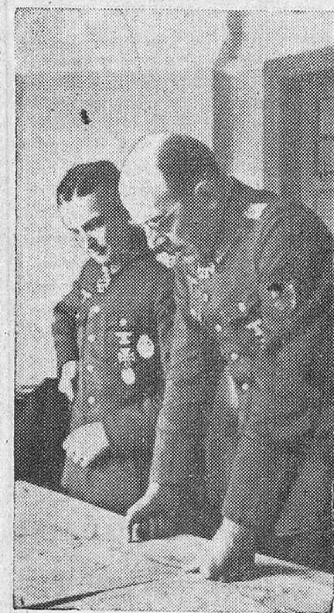
El general Karl Holidt, poseedor de las hojas de roble de la Cruz de Caballero de la Cruz de Hierro, delibera sobre la situación de sus tropas con otro general alemán.