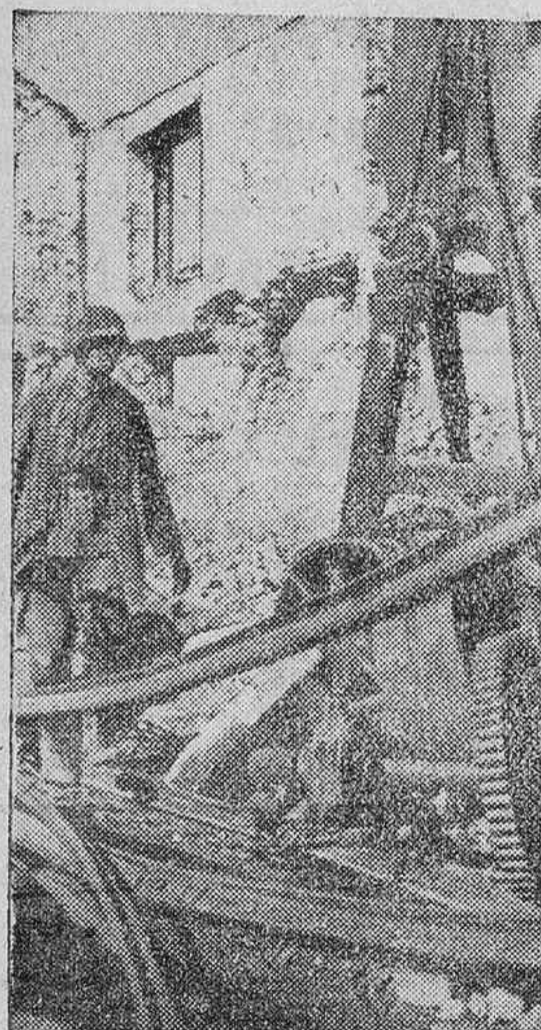
He aquí los restos de una fábrica rusa bombardeada antes de ser ocupada por las tropas alemanas.