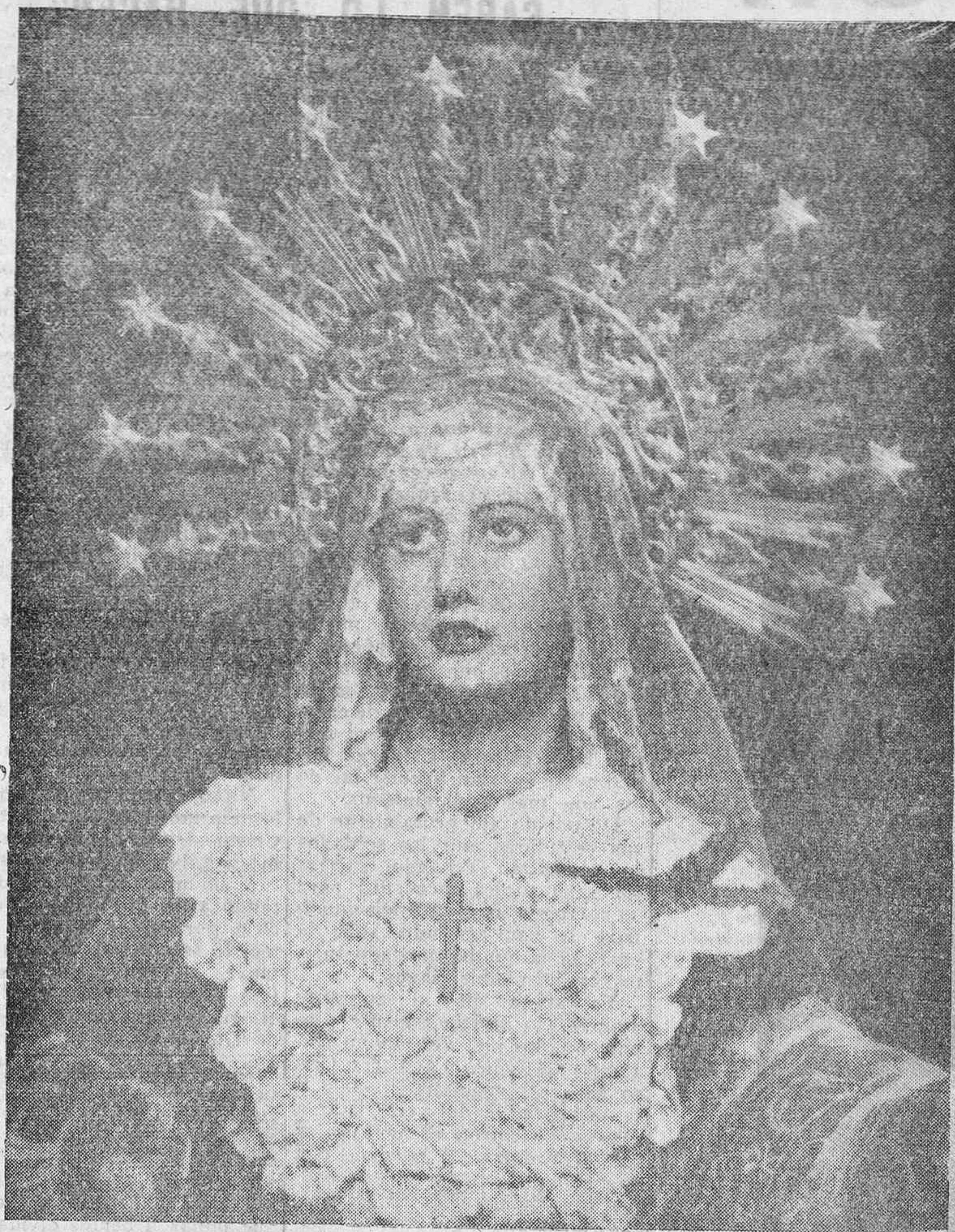
"Oh vosotros los que pasáis por mi camino, mirad y contemplad si existe dolor igual a mi dolor"