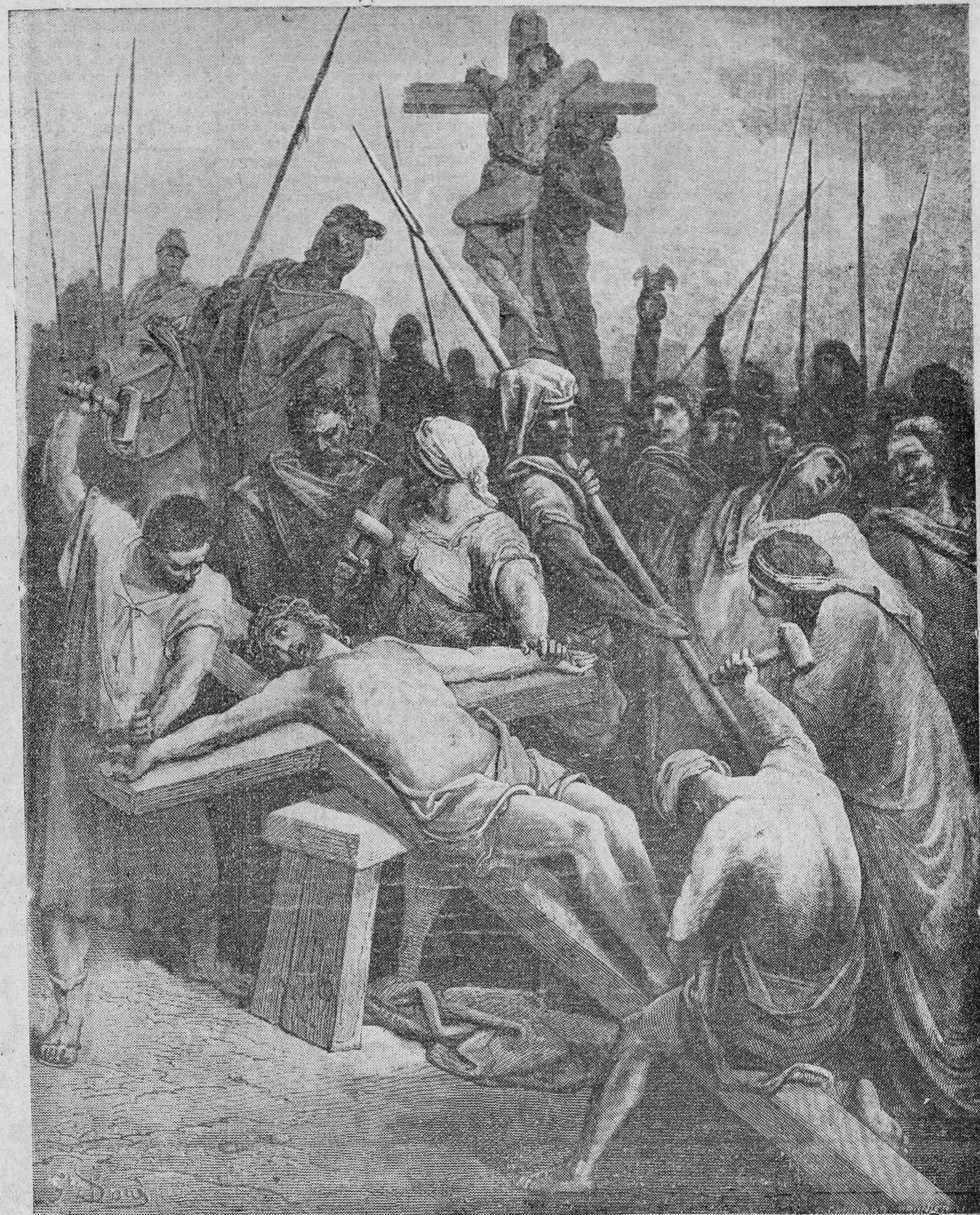
"TALADRARON MIS MANOS Y MIS PIES Y SE PUEDEN CONTAR TODOS MIS HUESOS".