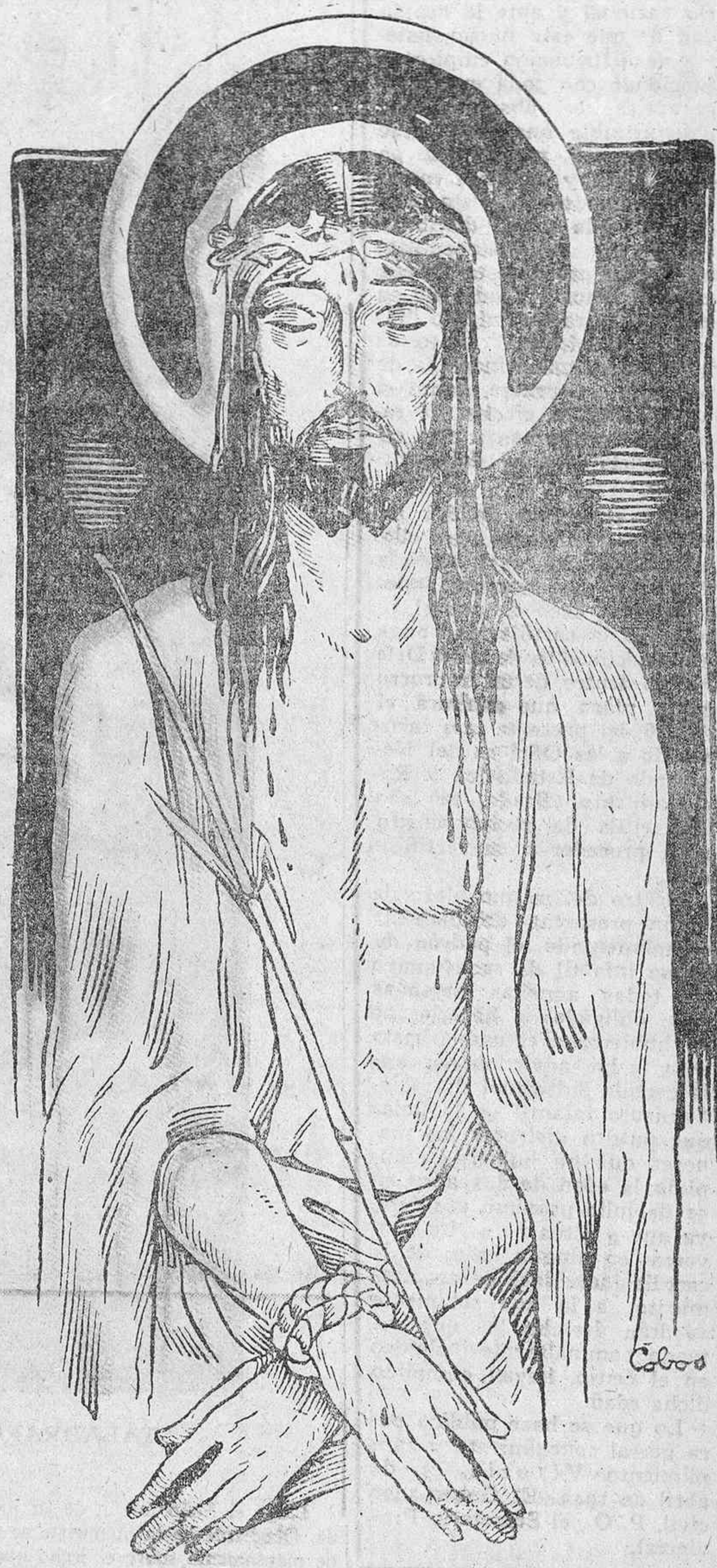
Salió Jesús con la corona de espinas y el vestido de púrpura, y Pilato dijo: He aquí al Hombre.