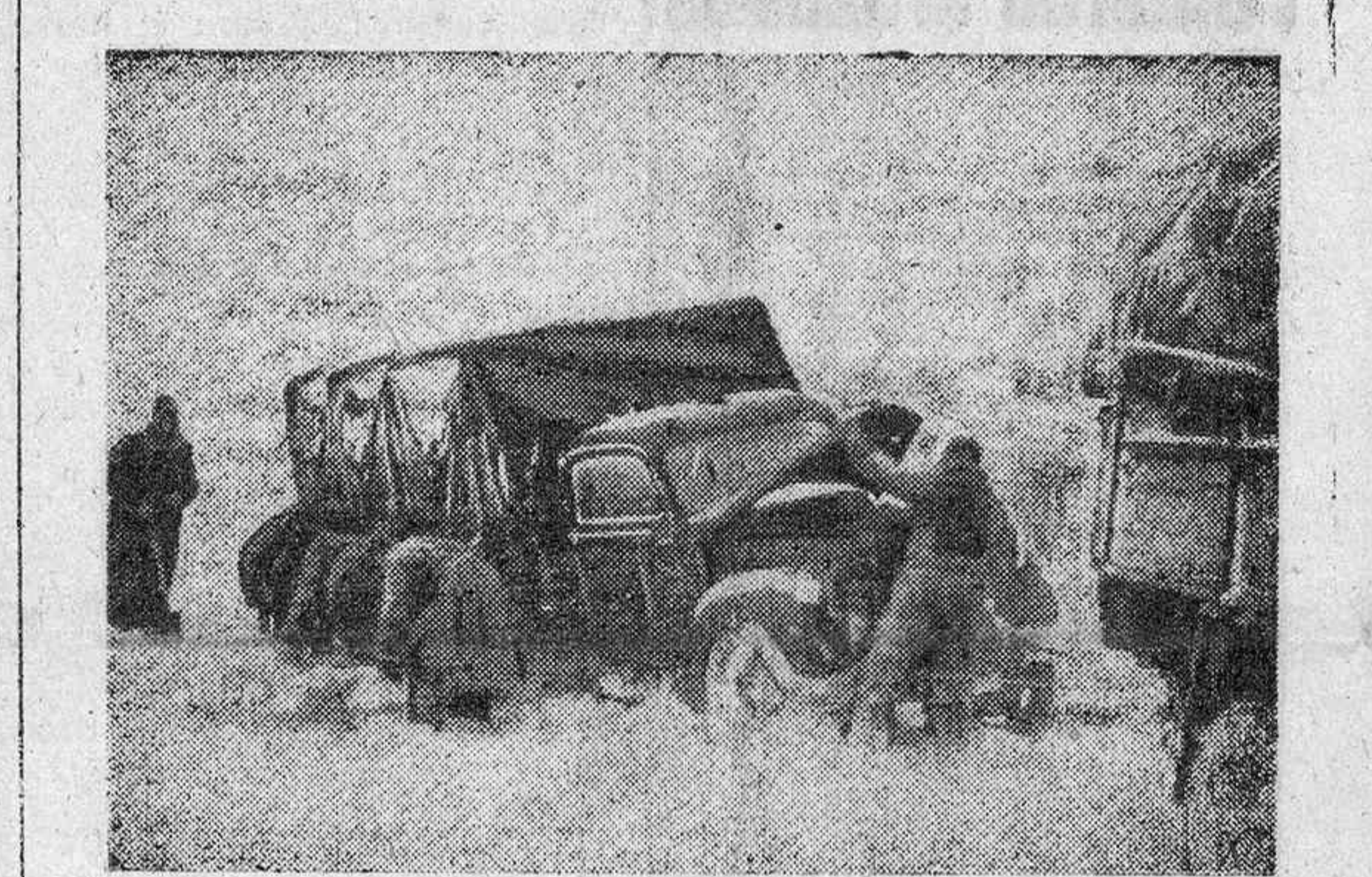
No obstante la nieve y el grande frío, los soldados alemanes saben superar en el Este todos los obstáculos.