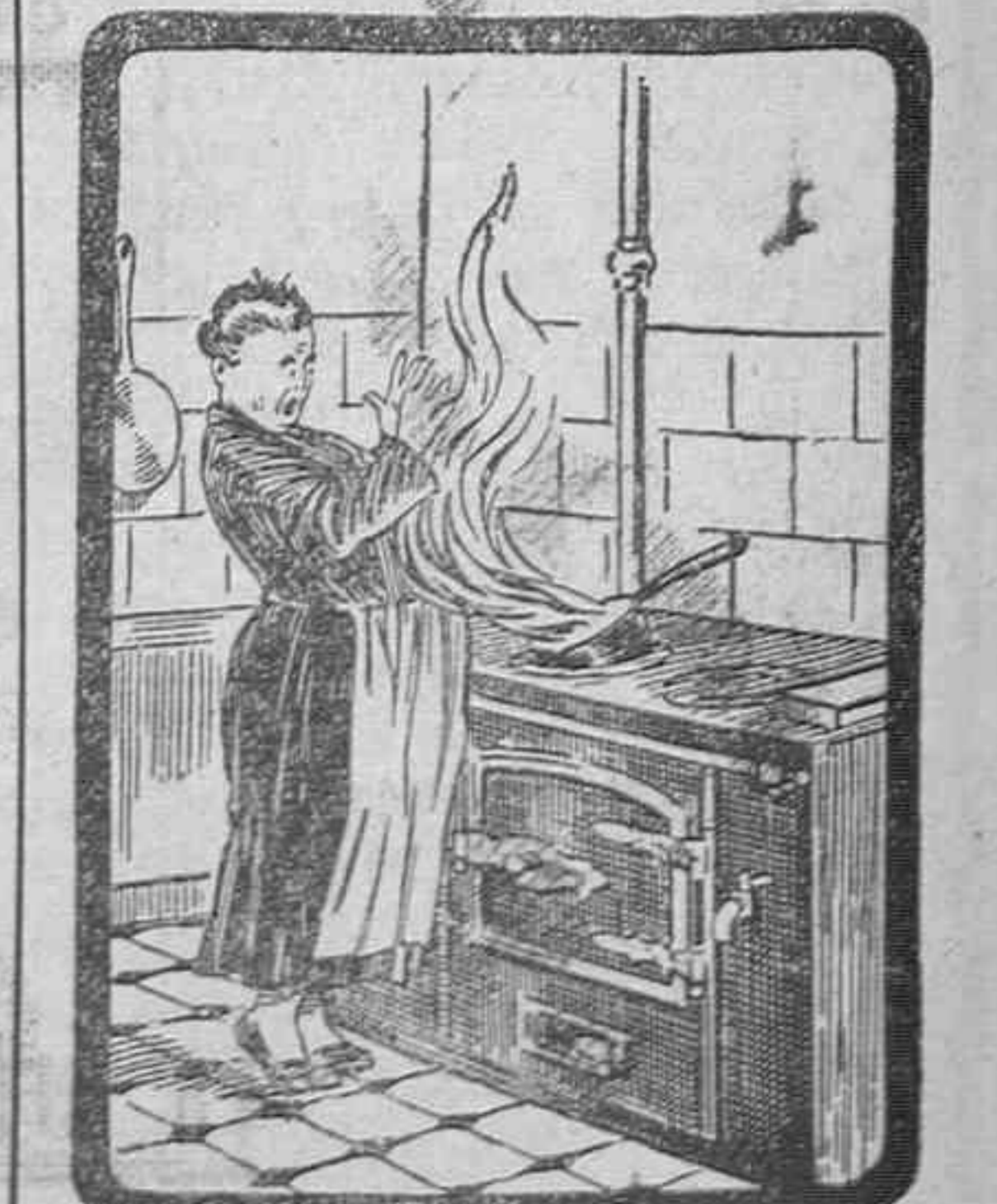
UN BUEN CONSEJO

No hacer en casa preparaciones—siempre deficientes—para lustrar suelas y muebles, porque el peligro de morir abrasada, os acecha.