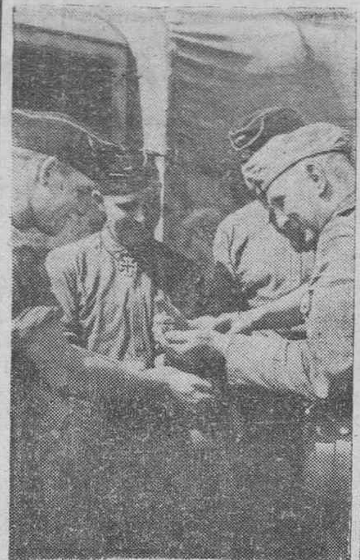
Uno de los jefes del Servicio del Trigo en Ucrania enseña orgulloosamente a unos oficiales alemanes la cosecha de este año en Ucrania