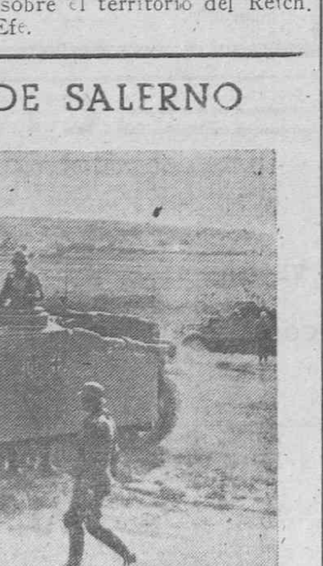
Tanques alemanes dispuestos para entrar en acción.