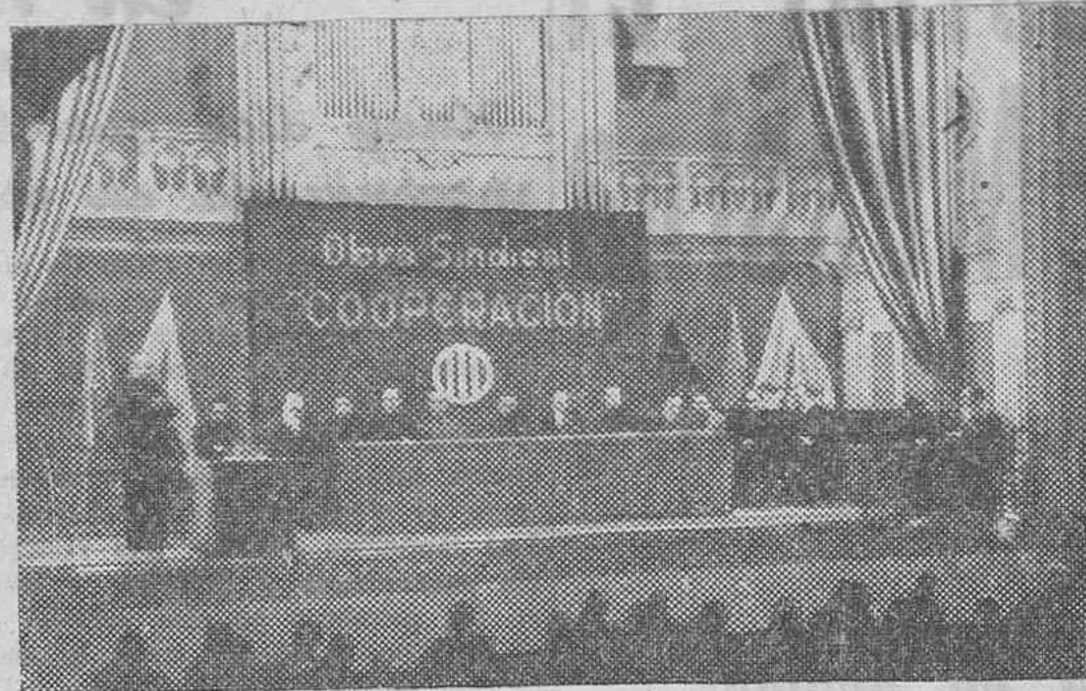
Momento de la solemne constitución en Bilbao, de la Unión Territorial de Cooperativas de la Zona VI, cuya cabeza radica en nuestra ciudad.