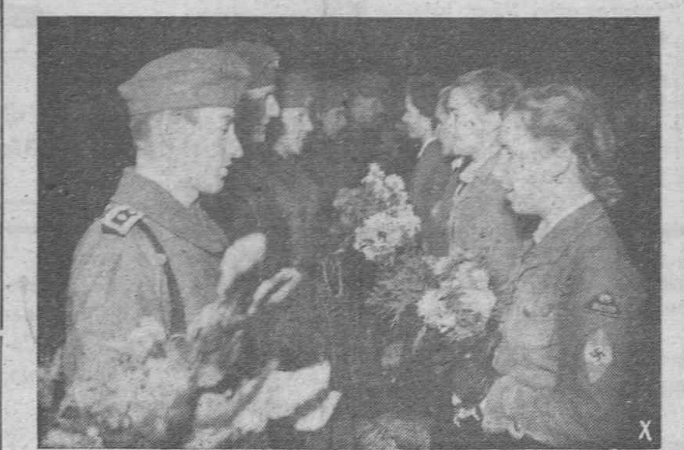
Son esperados por muchachas que les entregan ramos de flores a su llegada a la estación de la capital del Reich.