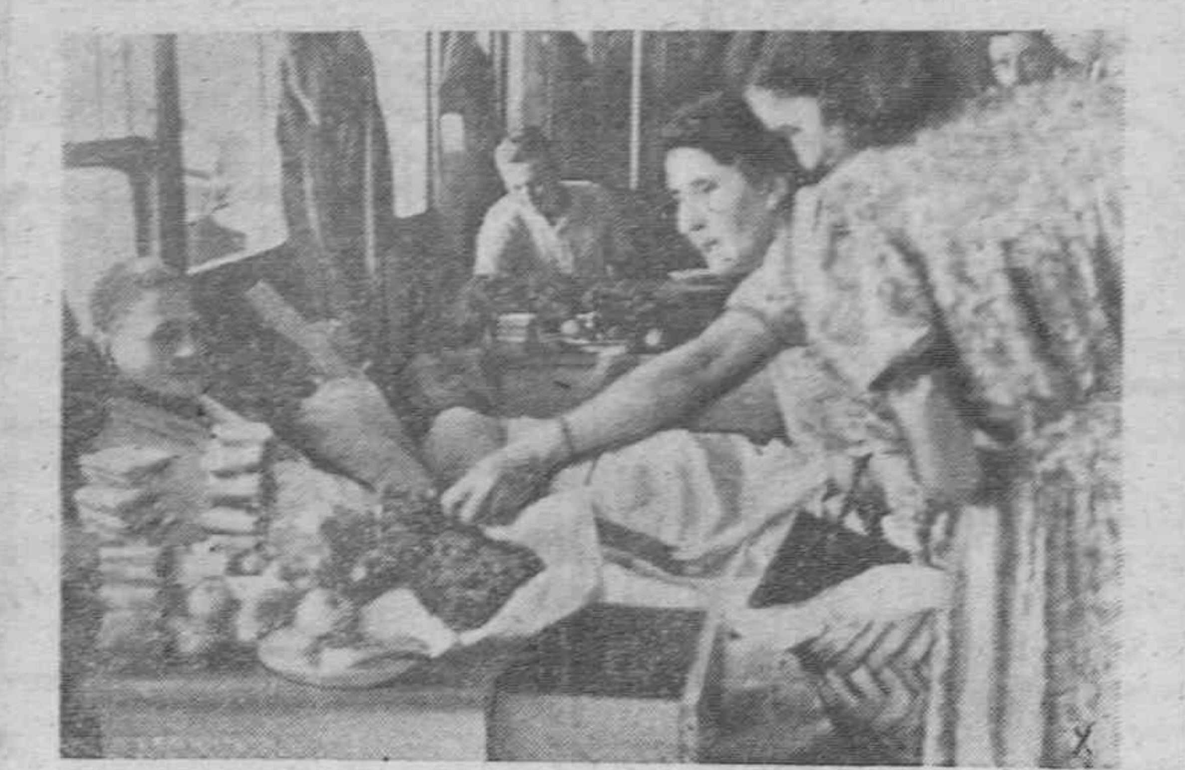
Soldados alemanes reciben dones y presentes y el saludo de las muchachas búlgaras a su paso por un puerto de este país.