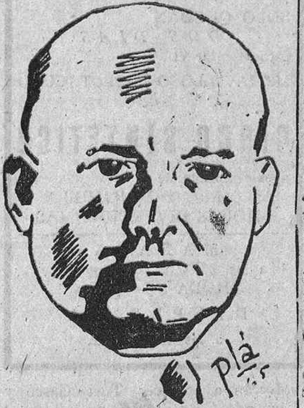
MICOLAJCZYK, ex jefe del Gobierno polaco de Londres.

Londres.—Mikolajczyk salió de Londres para Moscú en un avión británico. Según anuncian personas bien informadas, le acompaña Stanczyk. En los centros políticos polacos se dice que Mikolajczyk acudirá a la conferencia preparada para pedir la formación de un Gobierno provisional en el cual ninguno de los partidos tenga mayoría. El jefe polaco se negará totalmente a participar en un Gobierno controlado por los comunistas, porque en tales condiciones sería imposible una elección libre.