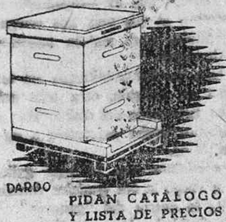
PIDAN CATÁLOGO Y LISTA DE PRECIOS