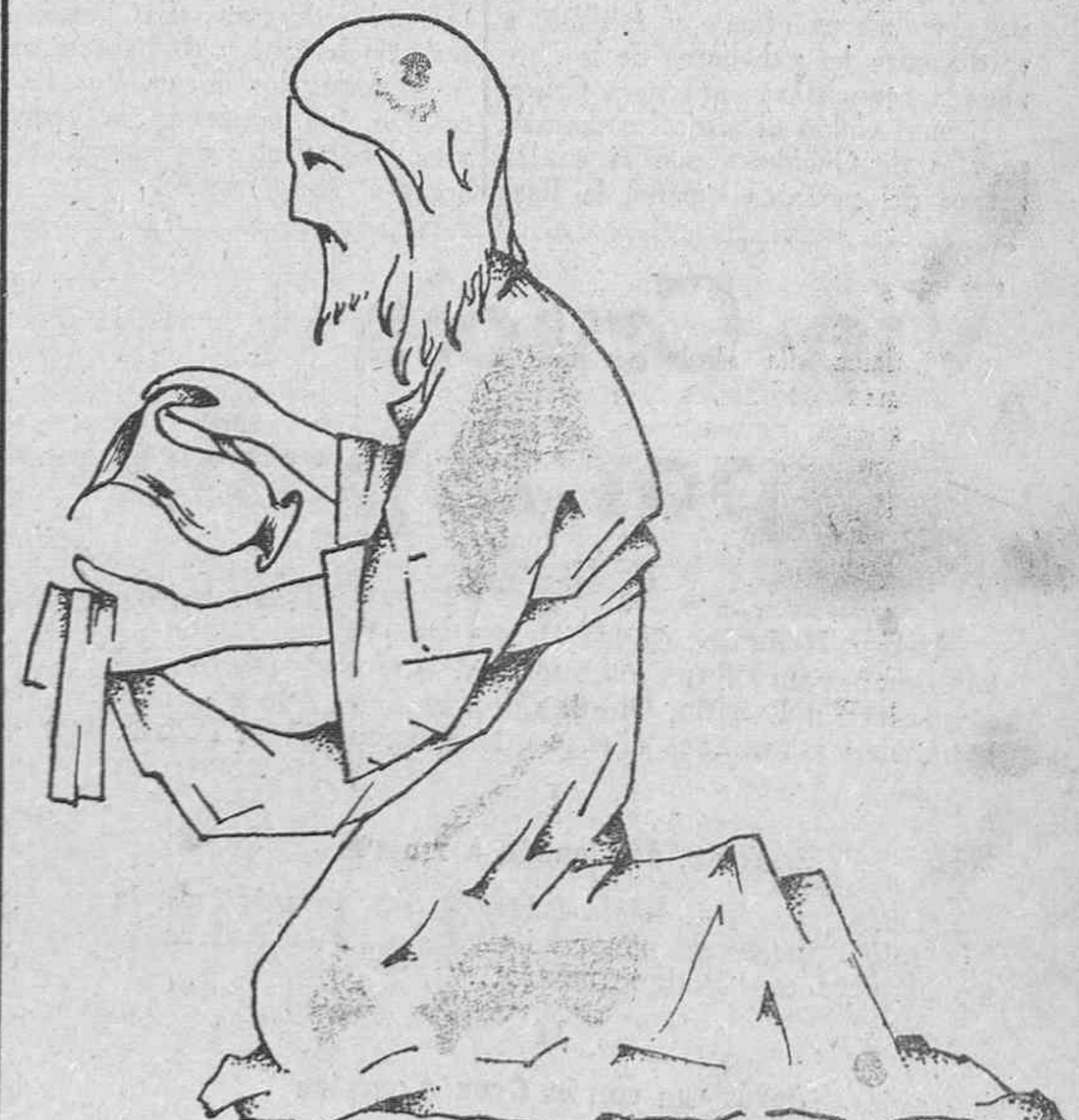
Pero el que venció en un árbol, en otro árbol fué vencido, tomando el Hijo de Dios la forma de siervo, haciéndonos por su humildad participantes de su Divinidad