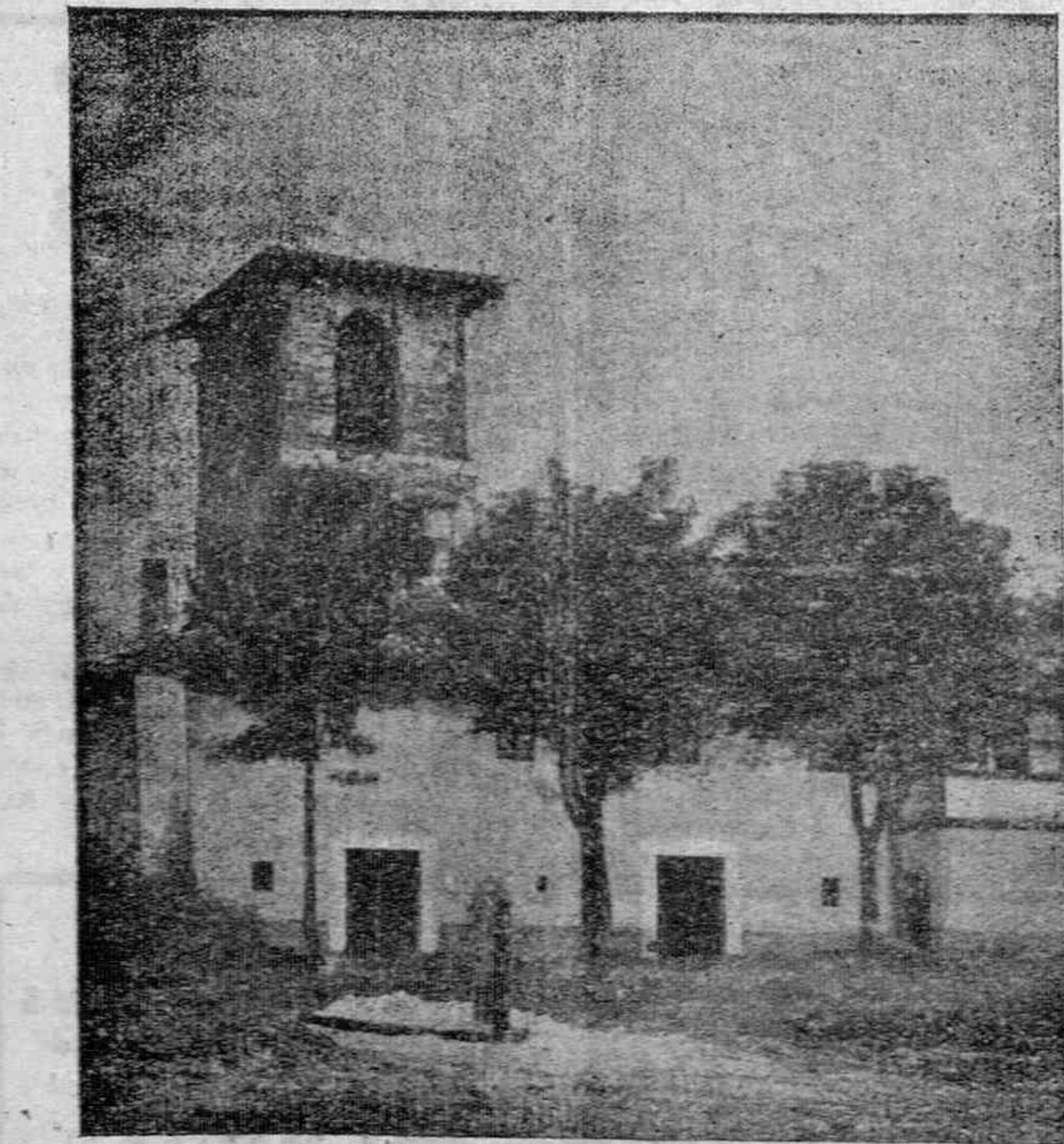
La pequeña parroquia rural de Abechuco, en cuyo templo, dedicado a San Miguel y en una de sus Capillas, cuajada de ex votos, se venera la milagrosa imagen del Santísimo Cristo de la Agonía.

Tuvo lugar la prueba en el teatro Calderón de la citada ciudad y el público que llenaba por completo la sala, premió con fervorosos aplausos la actuación de los jóvenes cantores cuya actuación entusiasmó a los concurrentes. Enalzado el acto, en el que intervinieron también los coros de Salamanca, Badajoz, Oviedo y Granada, el jurado presido por el