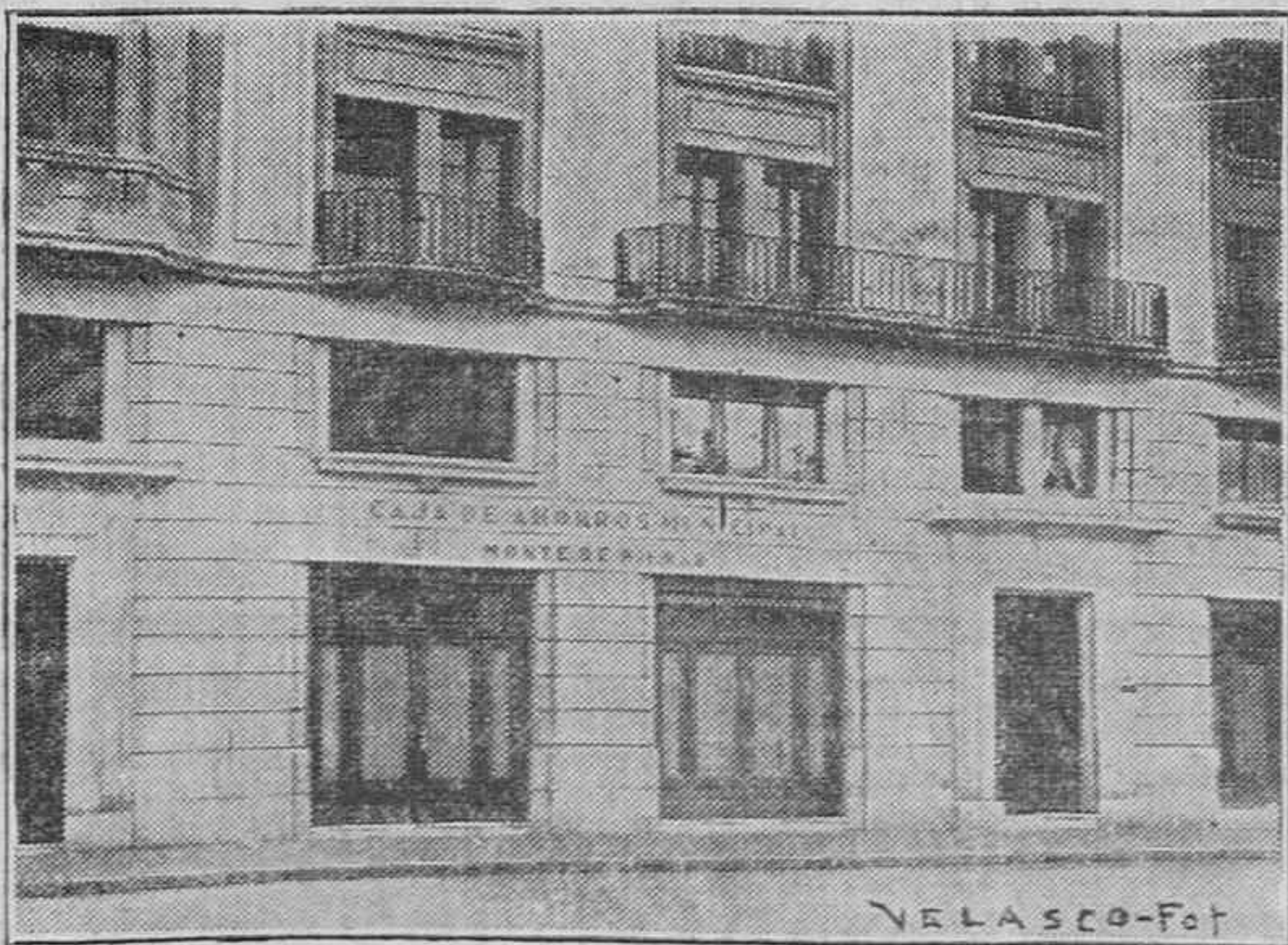
El ahorro bien administrado es el enemigo mayor de la usura.

Los que más barato venden Portal del Rey, 21.- Corre- ría, 21.- Independencia, 15 (Barretras)