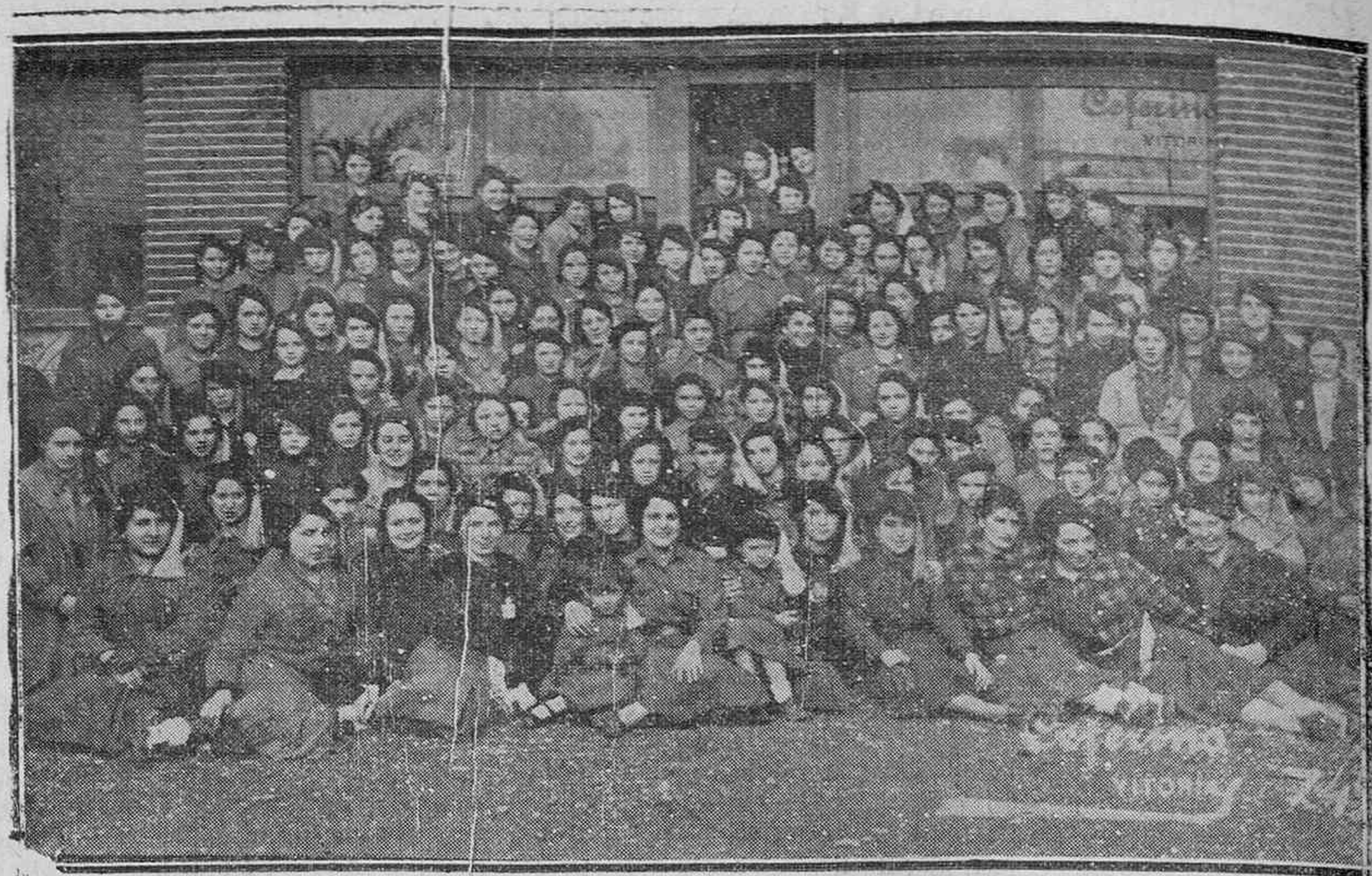
Un grupo de Margaritas que concurrieron ayer a la solemne Entronización del Sagrado Corazón de Jesús en los locales sociales de las Margaritas-Requetés

El señor Pérez Ormazábal, en un inciso afortunadísimo, aludió a la emoción que como sacerdote