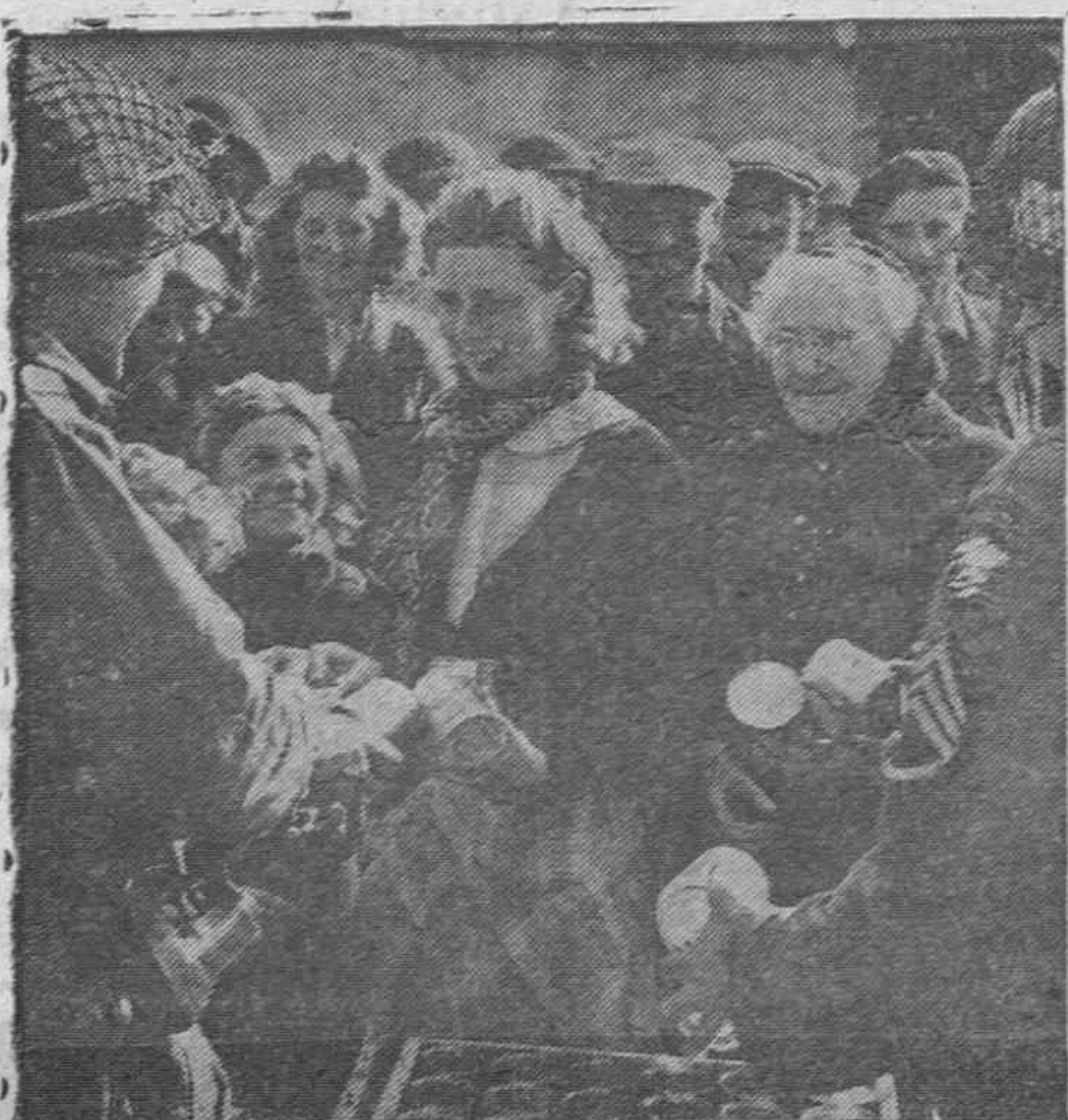
Los soldados aliados se ocupan del abastecimiento de las poblaciones de Europa más necesitadas y reparten los víveres mandados por la UNRRA.