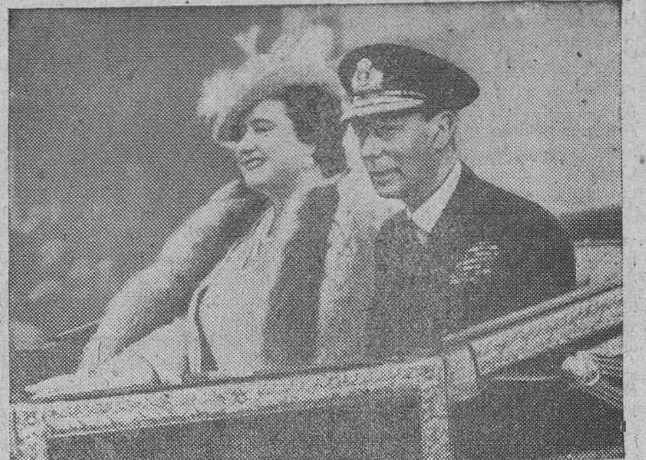
La reapertura del Parlamento británico coincidió con el día de la victoria sobre el Japón. Aquí vemos a S. M. los reyes de Inglaterra dirigiéndose en la carroza real hacia el Parlamento.