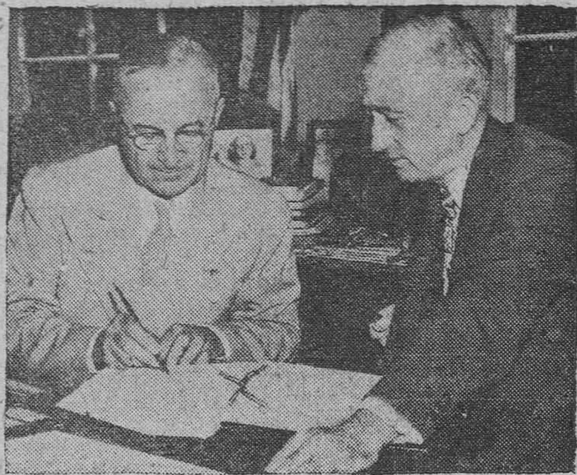
El Presidente Harry S. Truman firma el documento ratificando la Carta de las Naciones Unidas ante el Secretario de Estado James F. Byrnes.