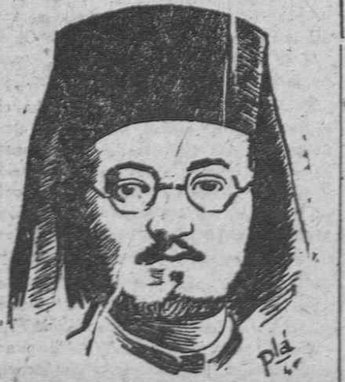
— 7 DAMASKINOS

cularle toda la ayuda que esté de su parte. Se espera poder entregar 2.500 camiones a Grecia en nombre de la UNRRA a fines de septiembre, para asegurar la distribución de abastecimientos de socorro y de las poblaciones. Gran Bretaña ha decidido ya enviar a Grecia varios buques de cabotaje y se espera que pronto haya más rívidos disponibles.—Efe.