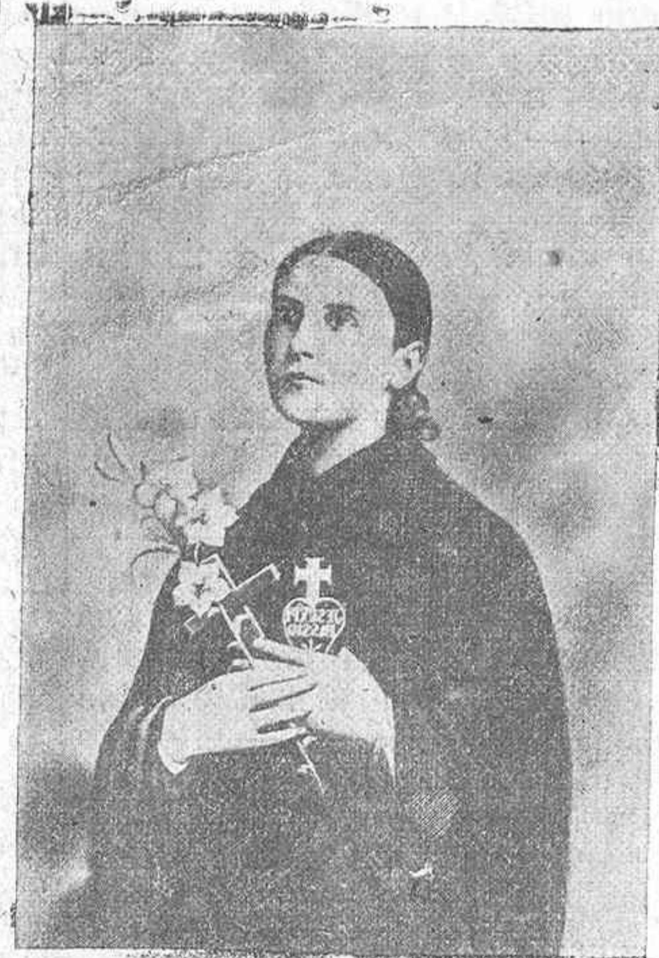
BEATÁ GEMA GALGANI

que mañana será elevada al honor de los altares. Con este motivo en el Convento de Pasionistas de Agosto (Alava) se le dedicarán cultos solemnísimos que presidirá nuestro excelentísimo Prelado.