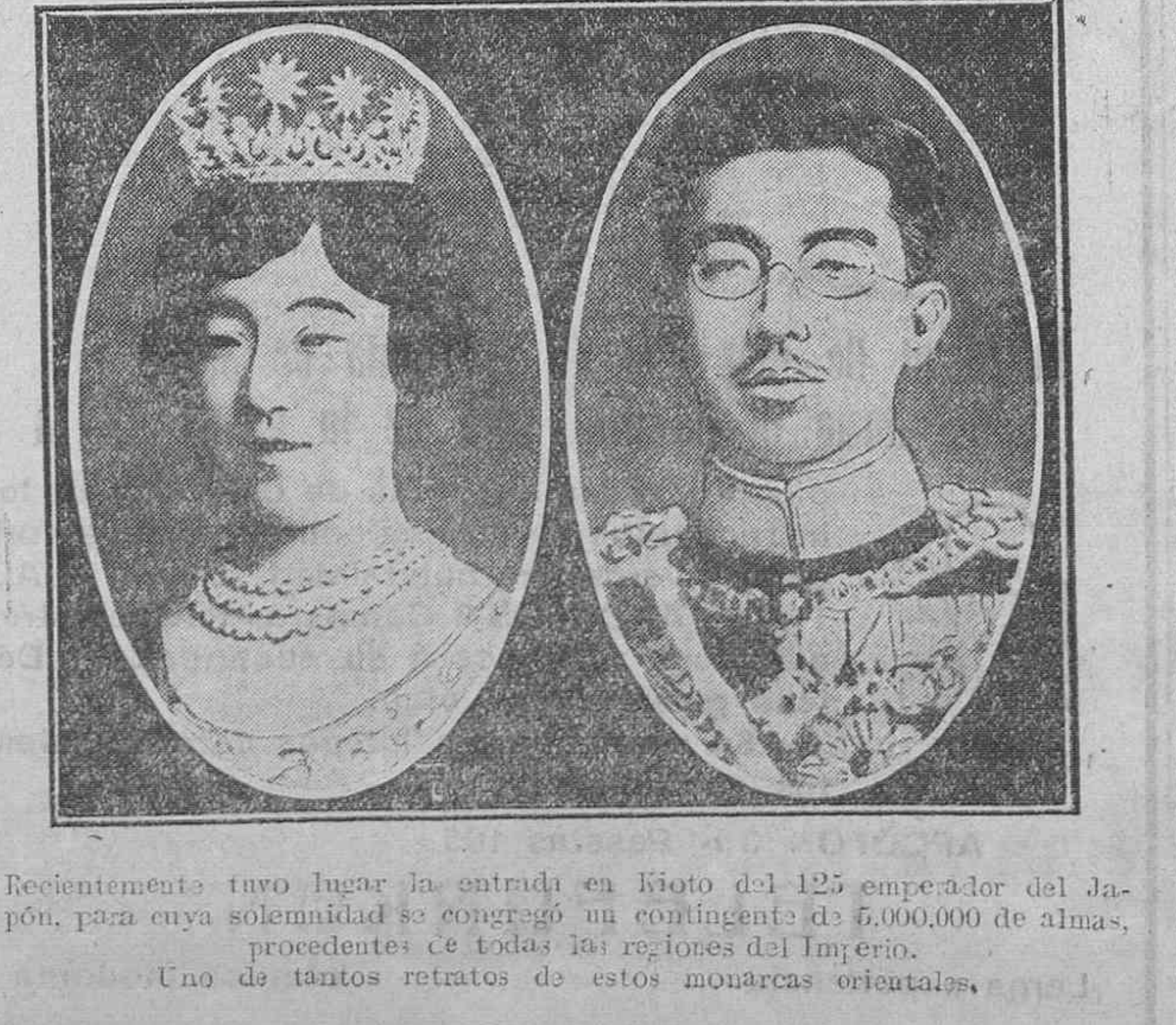
Recientemente tuvo lugar la entrada en Kioto del 125 emperador del Japon, para cuya solemnidad se congregó un contingente de 5.000.000 de almas, procedentes de todas las regiones del Imperio. Uno de tantos retratos de estos monarcas orientales.