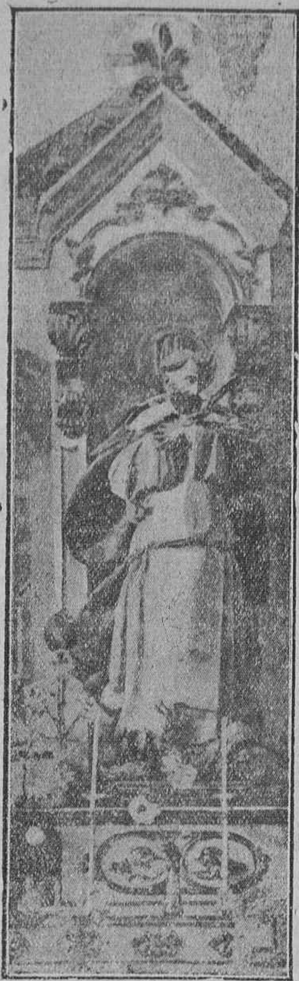
BEATO TOMAS DE ZUMARRAGA Y LAZCANO.

NACIONAL DE VITORIA, MISIONERO Y MARTIR DEL JAPON, cuya fiesta celebra hoy la Iglesia, y a quien, dentro de poco, dedicará nuestra Ciudad un grandioso homenaje.