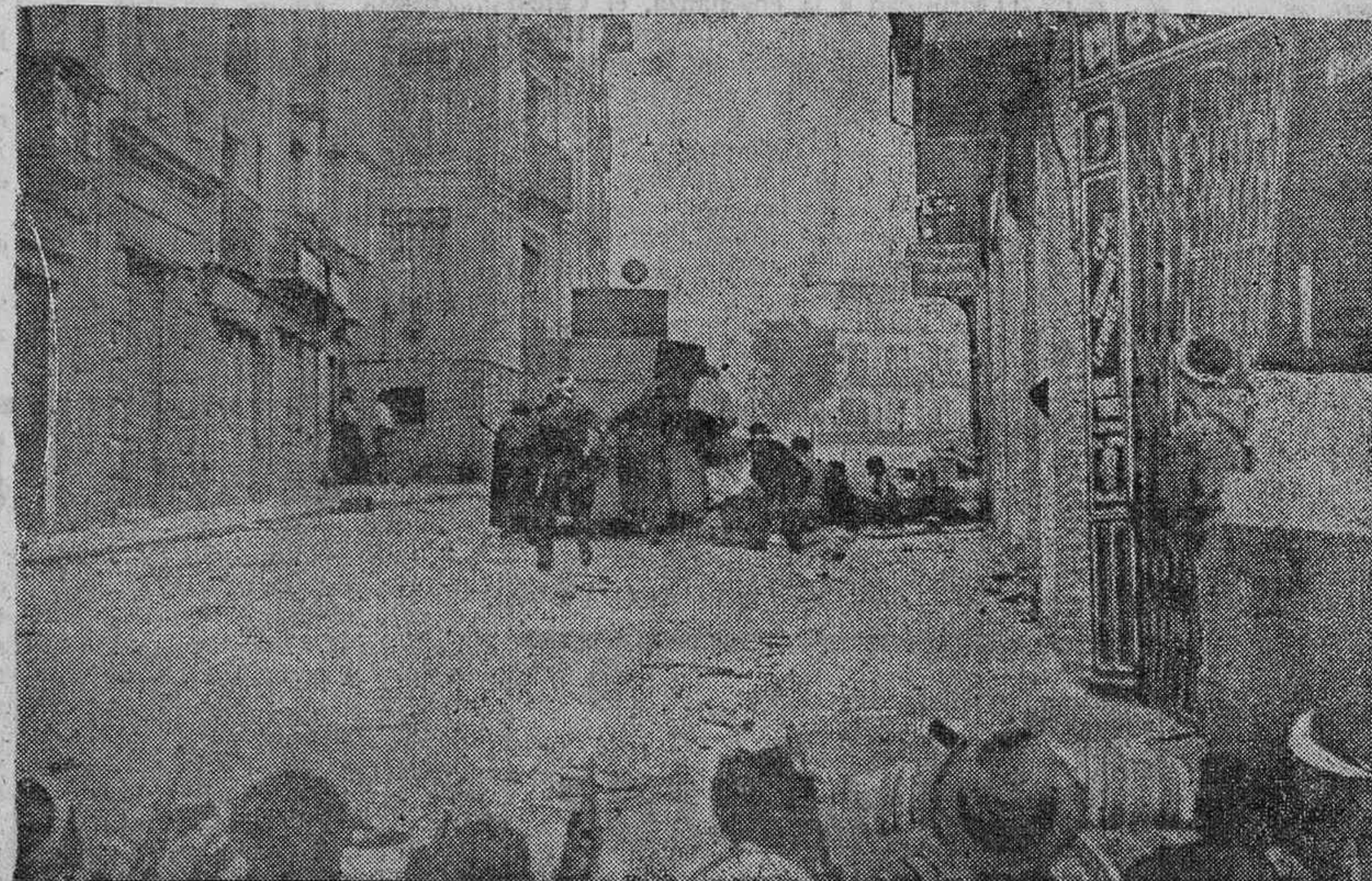
Los milicianos rojos, cuando el sábado 26 intentaban impedir la reconquista de Toledo

He aquí la reproducción de un ejemplar del diario "El Alcázar", editado por los heroicos sitiados en el histórico lugar