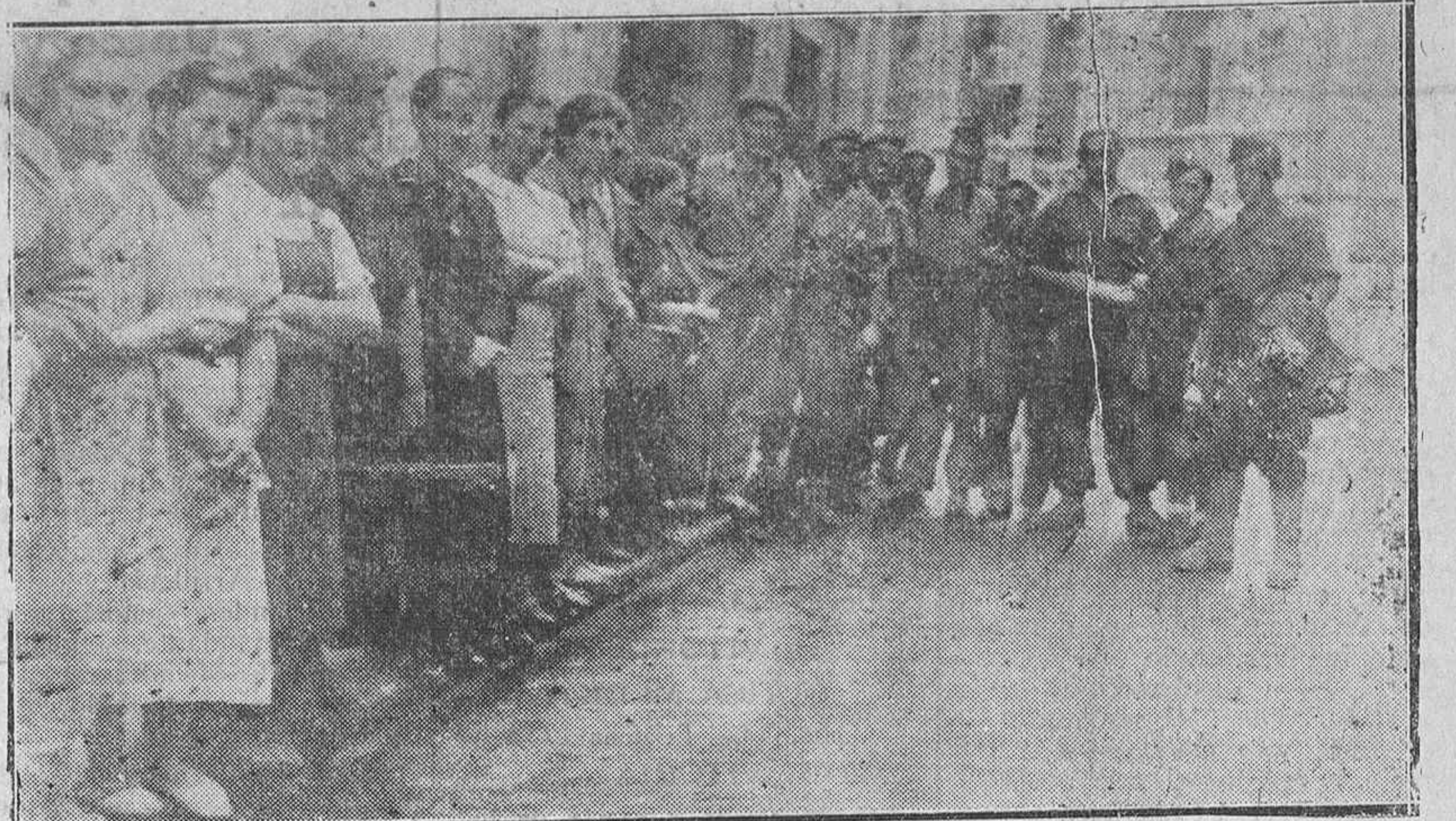
Llanes.—Una cola de muchachas de la población, para adquirir los viveres llevados allí por la Intendencia Militar. Unidos al grupo, muchachos de Radio Requeté y de la segunda bandera de la Falange

La familia invita a sus amistades a estos sufragios y testimonia su agradecimiento a cuantos asistieron a la conducción del cadáver y funerales del finado.