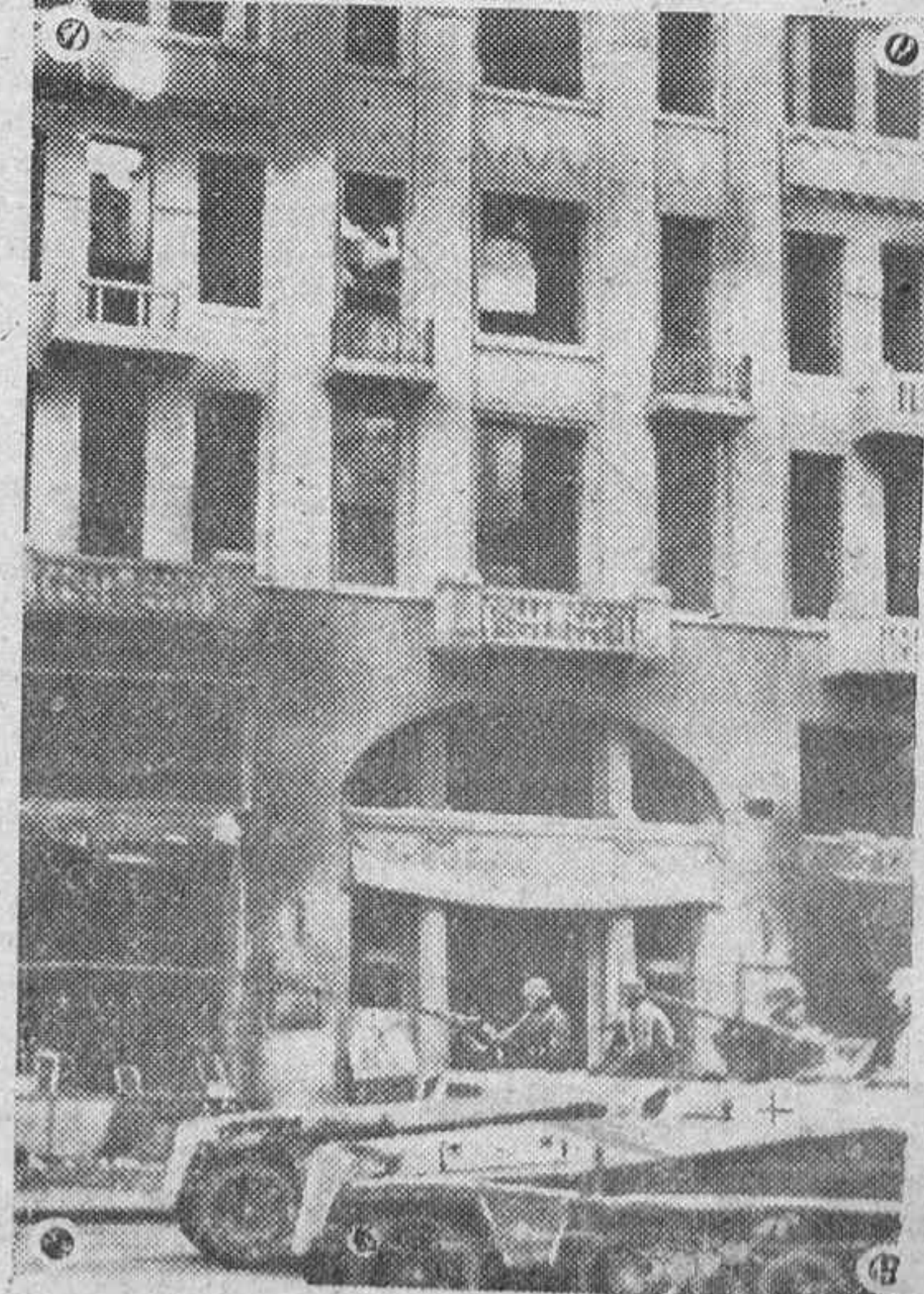
Un grupo de soldados soviéticos se hicieron fuertes en una casa de Charcow. Rápidamente los tanques alemanes acuden para abarcar la resistencia.

Prensa y radio se ocupan, al presente, del libro "Madrid", de "Azorín" sobre la tan traída generación del 98. Todo se reduce a que esta generación, dicen no tendía a España, ni los destinos de España. Y es que no entendían el catolicismo, o lo tomaban, cuando más, como ambiente para una novela. Y eso no es el catolicismo. Como tampoco es trampolín político. — ACEBEDO.