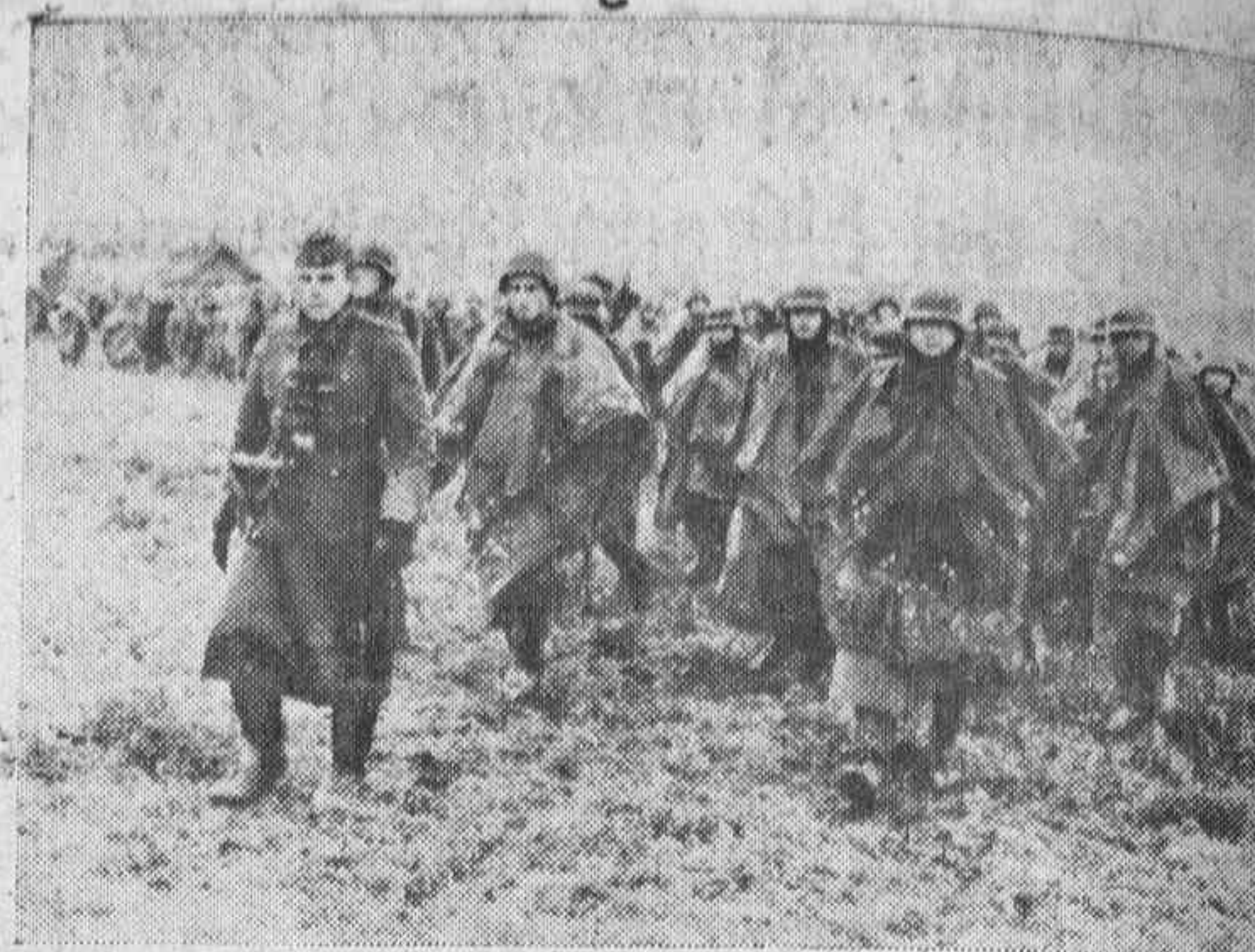
El avance alemán en el Este.—El tiempo fue muy desfavorable y duro durante los últimos combates de decisión. Las carreteras inundadas hacían casi imposible el avance de las tropas. El espíritu combatiente de éstas fue extraordinario.

Los puertos de Sebastopol, Kerch y Jalta han sido eficazmente atacados por la acción de los bombarderos alemanes. Dos mercantes de diez mil toneladas y un patrullero han sido hundidos por la acción de las bombas, así como otros cinco mercantes más seriamente averiados. También resultaron con averías un crucero y un torpedero soviéticos.